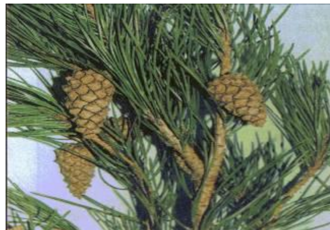
Шишки сосны обыкновенной