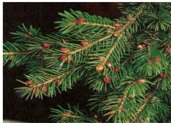
Мужские шишки ели