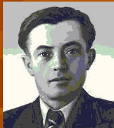
Я. Ф. Павлов.

В период обороны Сталинграда ночь на 27 сентября 1942 разведывательная группа, возглавляемая Павловым, захватила в центре города, на улице им. 9 января четырехэтажный дом, закрепились в нем и трое суток под шквальным огнем противника удерживала. Затем в дом прибыло подкрепление, и он стал важным опорным пунктом в системе обороны дивизии. 24 воина оборонялись в укрепленном доме, отражая яростные атаки противника, в течение 58 дней. Этот дом вошел в историю Сталинградской битвы как «Дом Павлова», а сам Павлов за свой подвиг был удостоен звания Героя Советского Союза. Награжден орденом Ленина, орденом Октябрьской Революции, 2 орденами Красной Звезды и медалями.