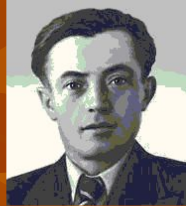
Я. Ф. Павлов.

В период обороны Сталинграда ночь на 27 сентября 1942 разведывательная группа, возглавляемая Павловым, захватила в центре города, на улице им. 9 января четырехэтажный дом, закрепилась в нем и трое суток под шквальным огнем противника удерживала. Затем в дом прибыло подкрепление, и он стал важным опорным пунктом в системе обороны дивизии. 24 воина оборонялись в укрепленном доме, отражая яростные атаки противника, в течение 58 дней. Этот дом вошел в историю Сталинградской битвы как «Дом Павлова», а сам Павлов за свой подвиг был удостоен звания Героя Советского Союза. Награжден орденом Ленина, орденом Октябрьской Революции, 2 орденами Красной Звезды и медалями.