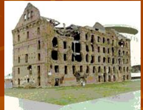
Дом Павлова в Волгограде.