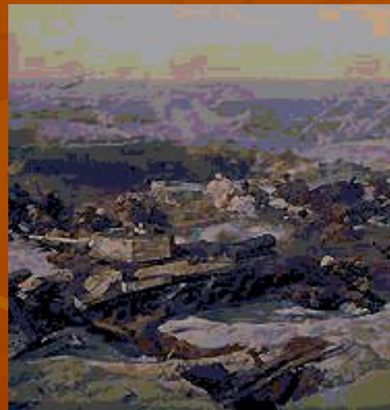
Фрагмент панорамы «Сталинградская битва».

Фашистские генералы получили приказ стереть с лица земли город на Волге. И 23 августа 1942 года тысячи самолётов с чёрными крестами обрушились на Сталинград. Гитлеровским войскам удалось прорваться в центр города. Бои шли за каждую улицу. В середине сентября противник, получив свежие резервы, усилил атаки. Немецко-фашистским войскам удалось выйти к Мамаеву кургану, закрепившись на отдельных высотах.