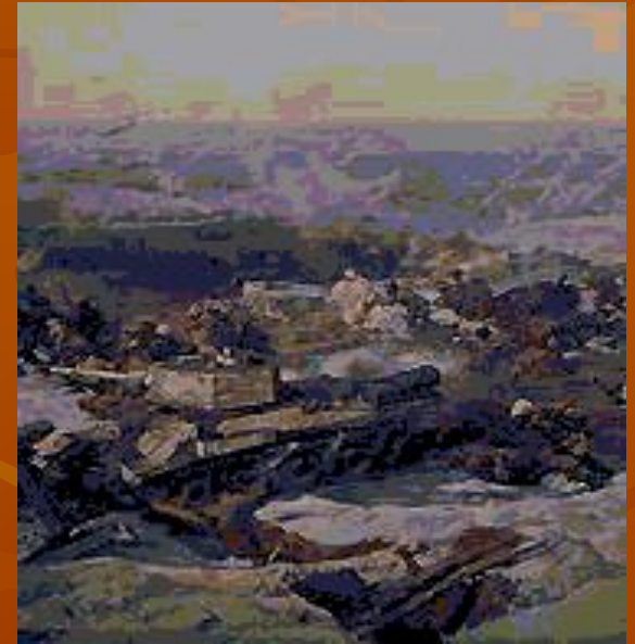
Фрагмент панорамы «Сталинградская битва».

Фашистские генералы получили приказ стереть с лица земли город на Волге. И 23 августа 1942 года тысячи самолётов с чёрными крестами обрушились на Сталинград. Гитлеровским войскам удалось прорваться в центр города. Бои шли за каждую улицу. В середине сентября противник, получив свежие резервы, усилил атаки. Немецко-фашистским войскам удалось выйти к Мамаеву кургану, закрепившись на отдельных высотах.