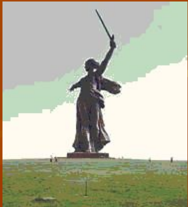
Центральный монумент «Родина-мать» высотой 52 м на Мамаевом кургане в Волгограде.

Мамаев курган, господствующий над основной частью города и обозначавшийся на военно-топографических картах, как высота-102,0 являлся главным звеном в общей системе обороны Сталинградского фронта. Именно он стал ключевой позицией в борьбе за волжские берега. Здесь в последние месяцы 1942 года проходили ожесточённые бои. Склоны кургана были перепаханы бомбами, снарядами, минами. Почва смешалась с осколками металла. Это место огромных людских потерь... Именно здесь, в районе Мамаева кургана, 2 февраля 1943 года закончилась Сталинградская битва.