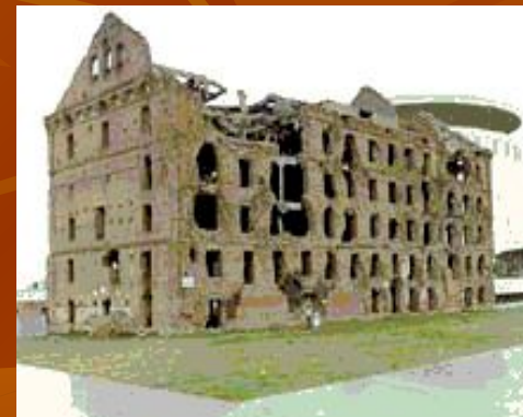
Дом Павлова в Волгограде.