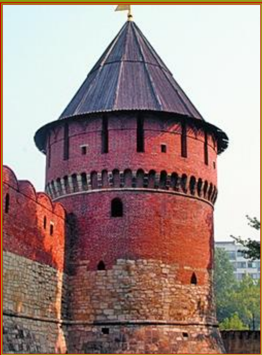
Ивановская (Тайницкая) башня