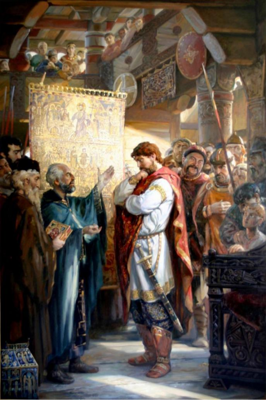
Филатов. Выбор Веры князем Владимиром

Независимо от того, имел ли место на самом деле факт прихода послов, летопись запечатлела реальную ситуацию выбора цивилизационной альтернативы, стоявшей перед Русским государством. Выбор любой из великих религий представлял для Руси большой шаг в духовном развитии по сравнению с язычеством. Все три великие религии – иудаизм, ислам, христианство – очень близки. Общим источником христианства и ислама был иудаизм, созданный учителями – пророками на Древнем Востоке в ходе духовной революции «осевого времени» VIII – III вв. до н.э. В отличие от язычества все эти религии исповедуют идею противопоставления человека и Бога, повседневного и идеального. Ограниченность возможностей и смертность человека есть следствие его греховности. Из-за неё ни в повседневной деятельности, ни посредством магических ритуалов человек не в состоянии добиться всего,