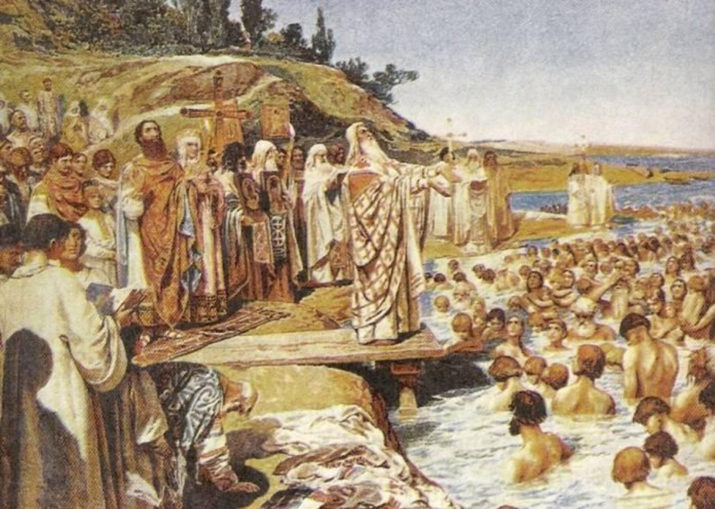
Перов В.Г. Крещение Руси. (вторая половина 1870-х - начало 1880-х)

Но киевские князья медлили с принятием христианства, так как принятие крещения «из рук византийцев» означало по тем временам переход новообращённого народа в вассальную зависимость от Византии.