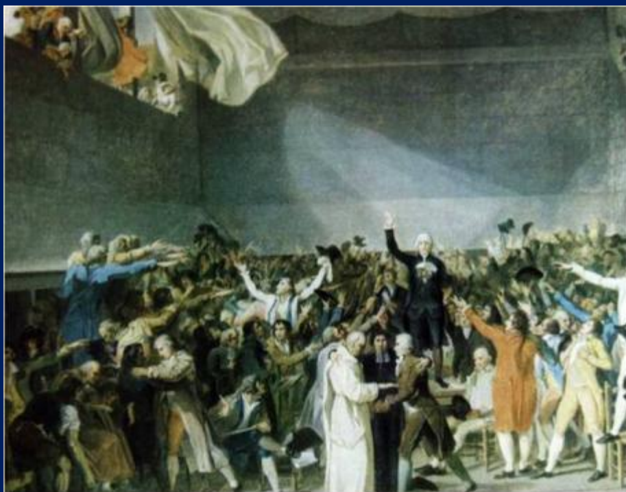
Клятва в зале для игры в мяч

17 июня 1789 г. депутаты III сословия провозгласили себя представителями всей нации Национальным собранием