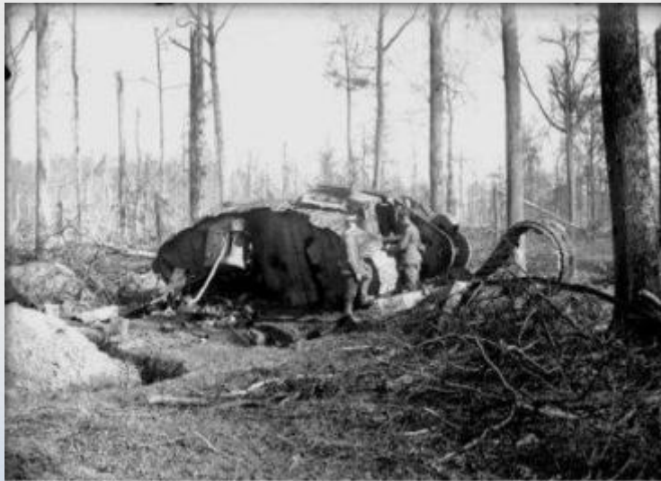
November - December

Однако в результате стремительной атаки пехота отстала, а танки продвинулись далеко вперёд, понеся серьёзные потери. 30 ноября 2-я германская армия совершила внезапную контратаку, отбросив силы союзников на первоначальные рубежи. Несмотря на отражение атаки, танки доказали свою эффективность в бою, а сама битва положила начало широкому применению танков и развитию противотанковой обороны.