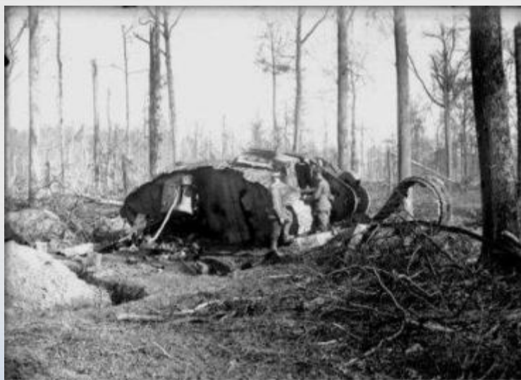
Битва при Камбре, 20 ноября 1917 г. Foto: A. Mg. 1101 November - October

Однако в результате стремительной атаки пехота отстала, а танки продвинулись далеко вперёд, понеся серьёзные потери. 30 ноября 2-я германская армия совершила внезапную контратаку, отбросив силы союзников на первоначальные рубежи. Несмотря на отражение атаки, танки доказали свою эффективность в бою, а сама битва положила начало широкому применению танков и развитию противотанковой обороны.