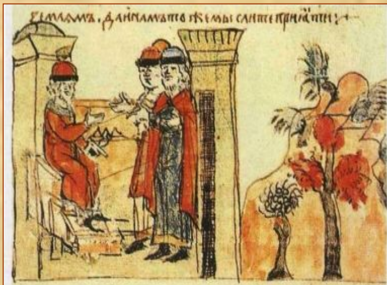
Изложение князю Владимиру своей веры хазарами