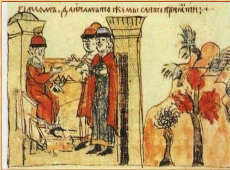
Изложение князю Владимиру своей веры хазарами