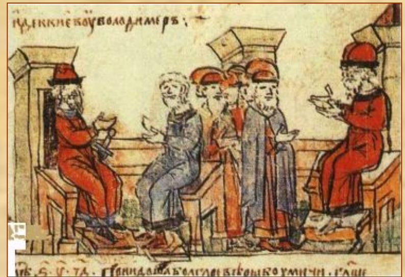
Изложение своей веры князю Владимиру мусульманами