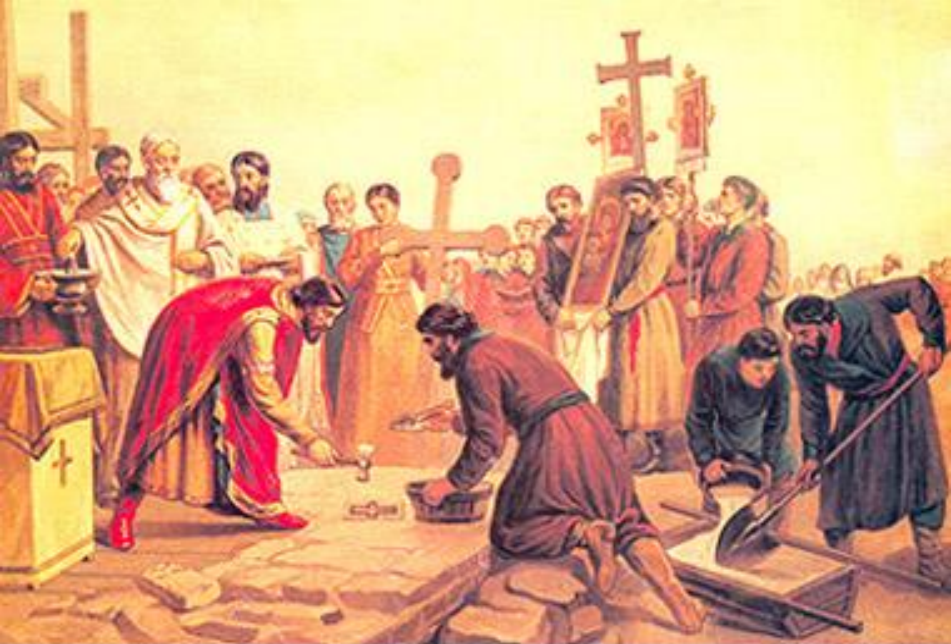
В.И. Верещагин Закладка Десятинной церкви в Киеве