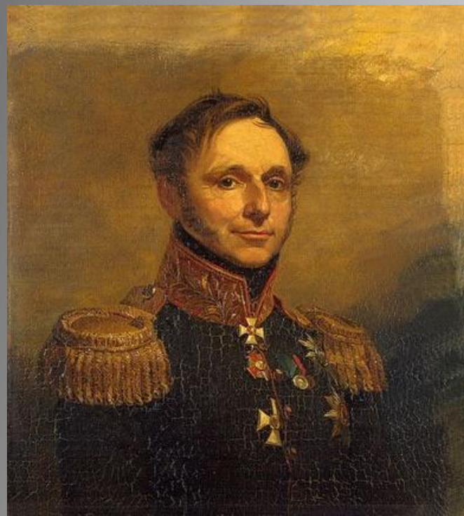
Эссен П.К. (1772-1844)

реформатор, законотворец, (1830-1842). основатель российской юридической науки и теоретического правоведения.