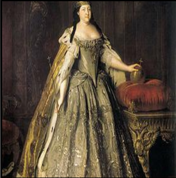
Анна Иоанновна (1693-1740)