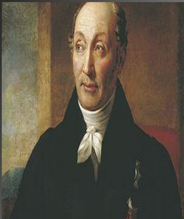
Сперанский М.М. (1772-1839)

реформатор, законотворец, (1830-1842). основатель российской юридической науки и теоретического правоведения.