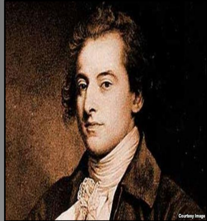
Тевкелев Алексей Иванович (1674-1766)

Российский дипломат, генерал-майор, основатель г. Челябинска