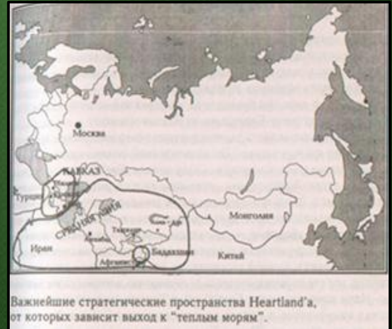
Важнейшие стратегические пространства Heartland'a, от которых зависит выход к "теплым морям".

В торгово-экономических связях обе стороны были одинаково заинтересованы. Путем товарообмена казахи приобретали предметы домашнего обихода, огнестрельное оружие, а русские получали от них различное сырье, скот. Русскому государству нужны были союзники в борьбе с потомками Кучума, беспрепятственный выход на рынки Средней Азии, безопасность пролегающих через территорию Казахстана караванных маршрутов. В свою очередь, казахи, подвергавшиеся постоянным разорительным набегам среднеазиатских ханств, были заинтересованы в расширении контактов с Москвой. Для обеспечения безопасности торговых связей с Казахстаном, Сибирью, Средней Азией Русское государство наряду с продвижением землепроходцев, купцов, посольств и военных отрядов приступило к интенсивному строительству на границе с Казахстаном укрепленных пунктов-крепостей.