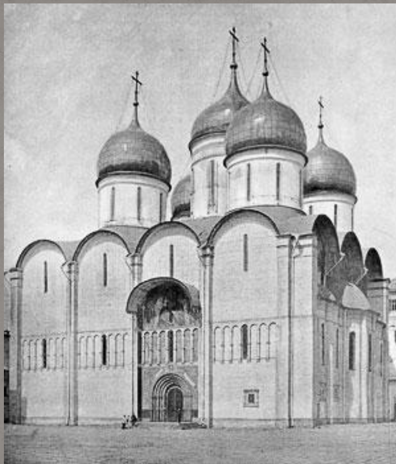
Успенский собор в Москве