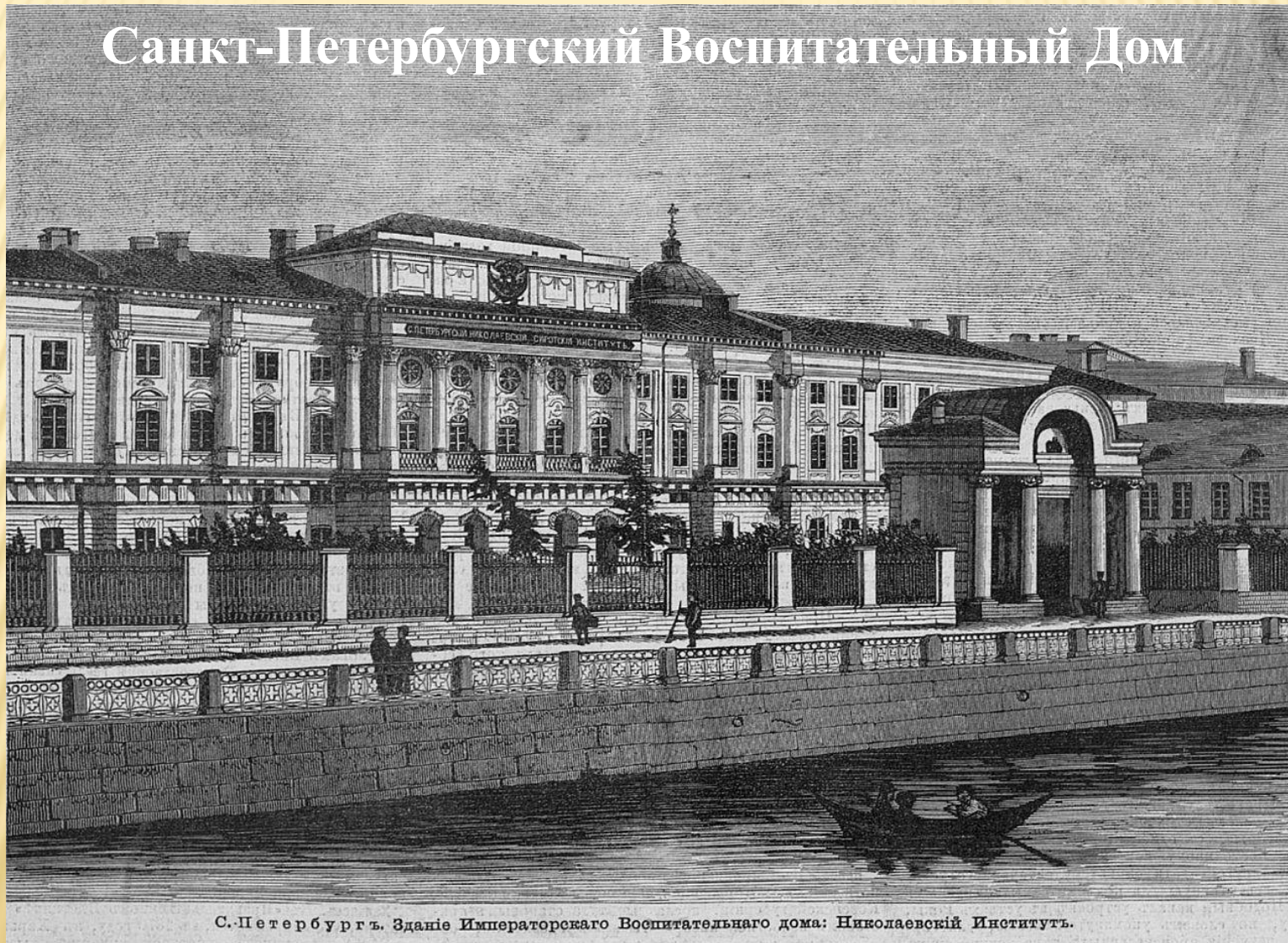
С. Петербургъ. Зданіе Императорскаго Воспитательнаго дома: Николаевскій Институтъ.