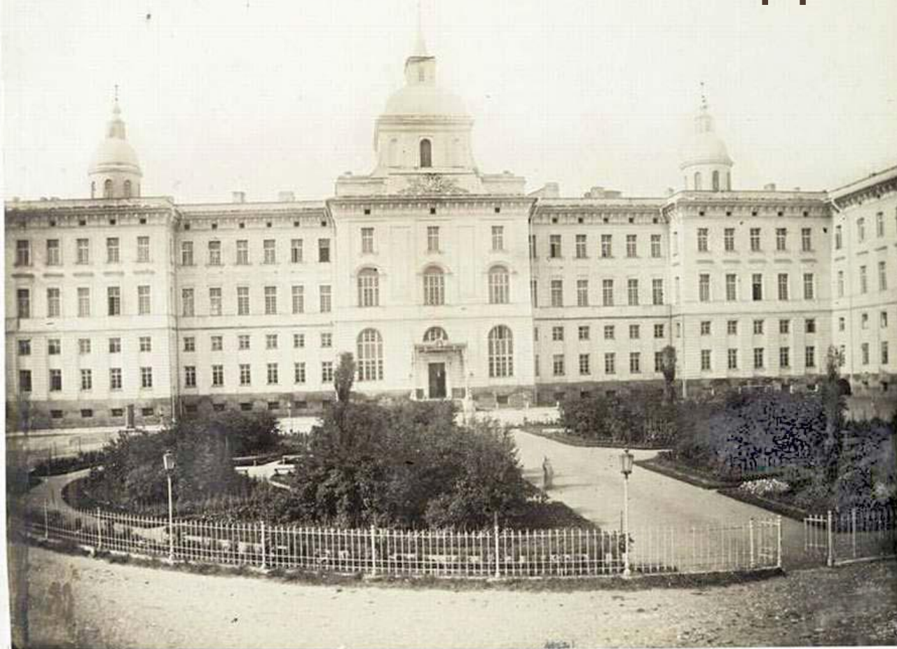
МОСКОВСКИЙ ВОСПИТАТЕЛЬНЫЙ ДОМЪ со стороны вольшаго подъезда.