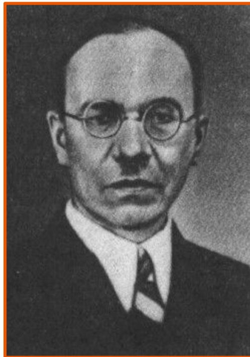
М. Н. Тихомиров

М.Н. Тихомиров: «Нет никакого сомнения, что Киевская Русь была уже знакома с концентрацией ремесленников в определенных городских кварталах», «Эта концентрация была предпосылкой к созданию ремесленных объединений».