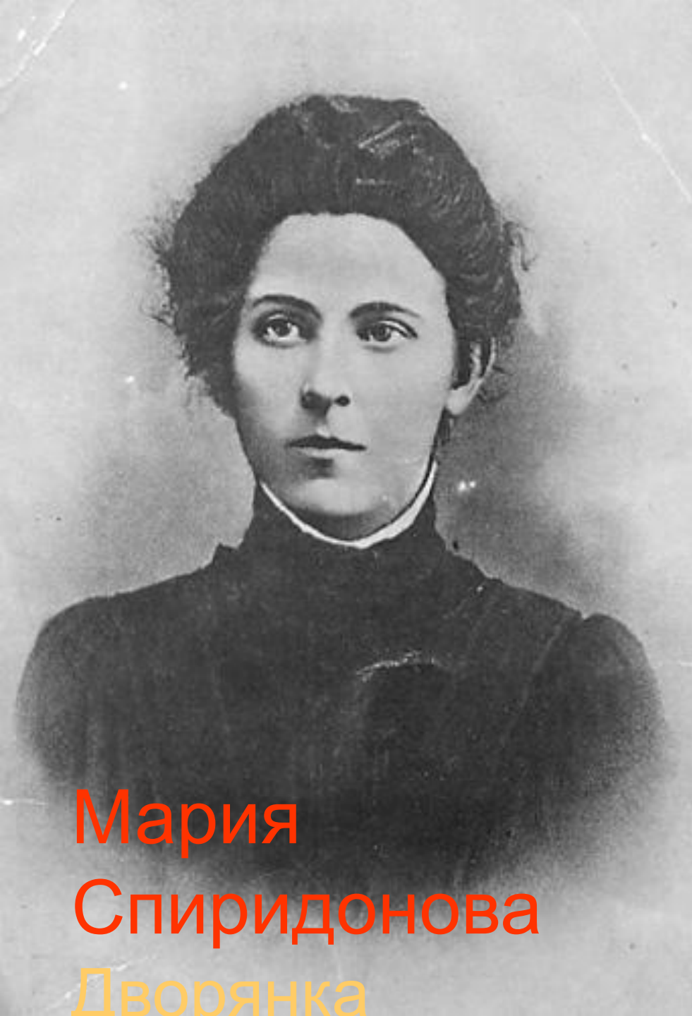
Мария Спиридонова Дворянка