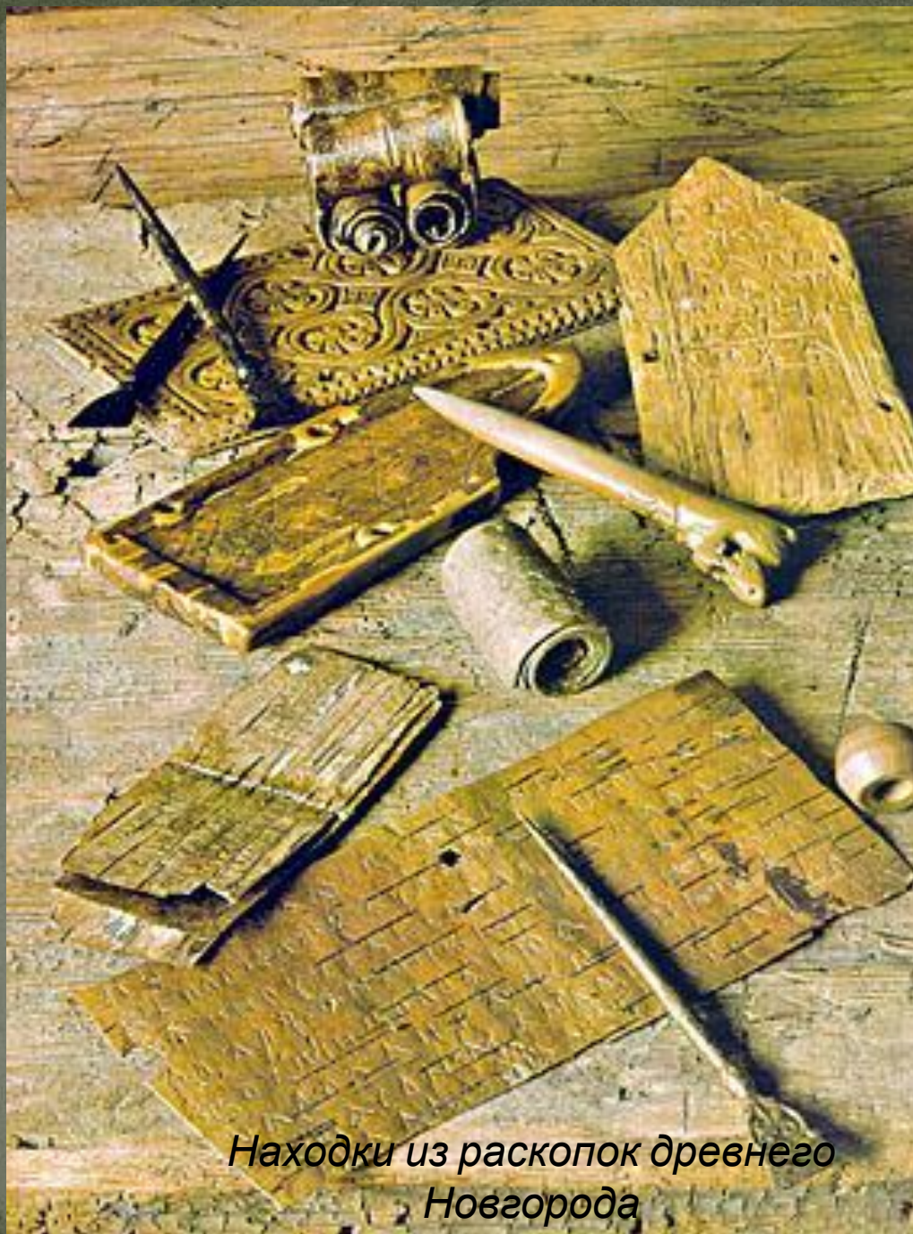
Находки из раскопок древнего Новгорода

Основной способ обнаружения археологических памятников – раскопки. Археологические находки помогают восстановить внешний облик людей, живших много лет назад, узнать об их культуре и быте.