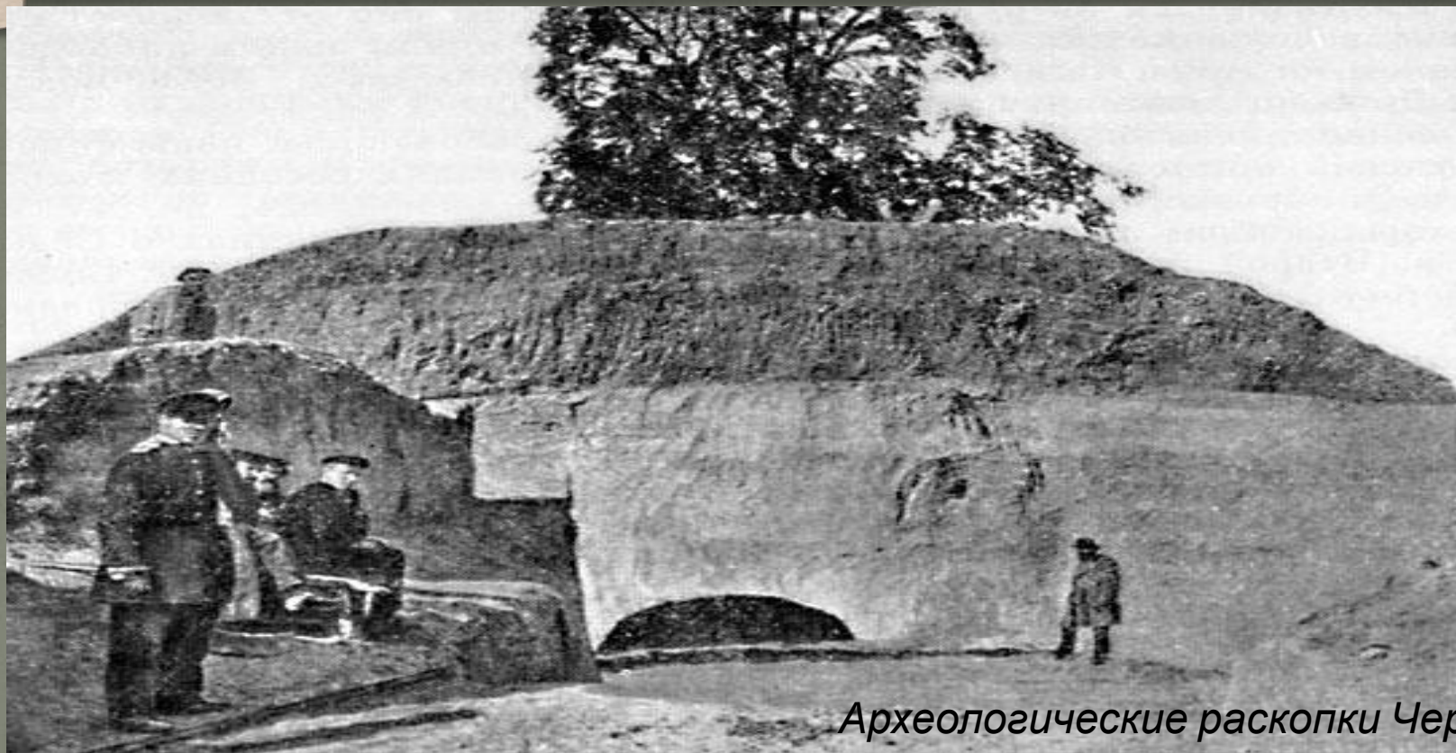
Археологические раскопки Черной могилы (X век) в Чернигове

Наука о древностях, изучающая прошлое по вещественным источникам, называется археологией