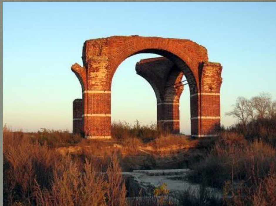
Старая Рязань Собор Бориса и Глеба

Археологи изучают отдельные археологические находки и археологические памятники