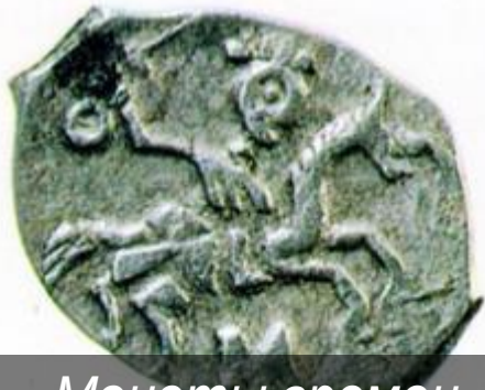
Монеты времен Ивана III и Василия III