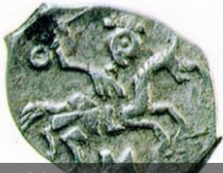
Монеты времен Ивана III и Василия III