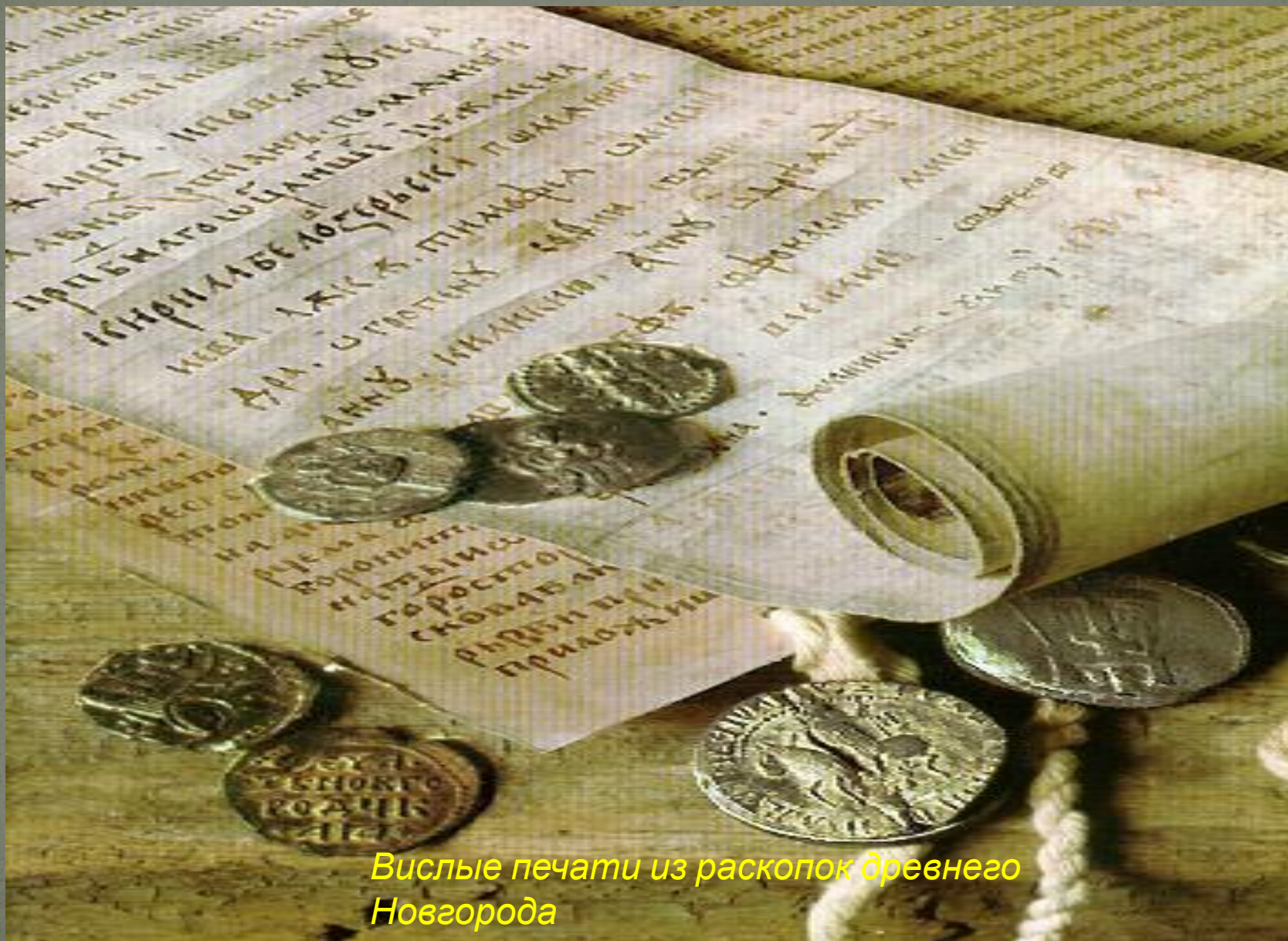
Вислые печати из раскопок древнего Новгорода