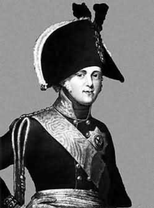
Император Александр I