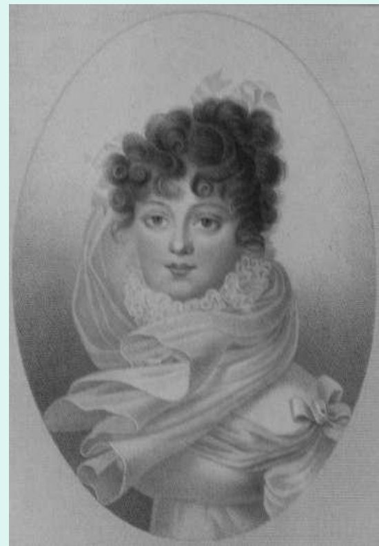
Екатерина Павловна (1788–1819), великая княжна, четвертая дочь императора Павла I, герцогиня Ольденбургская