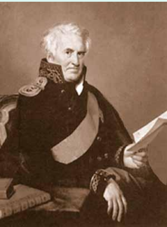
Александр Семенович Шишков (1754–1841), адмирал, писатель, основатель литературного общества «Беседы любителей русского слова».