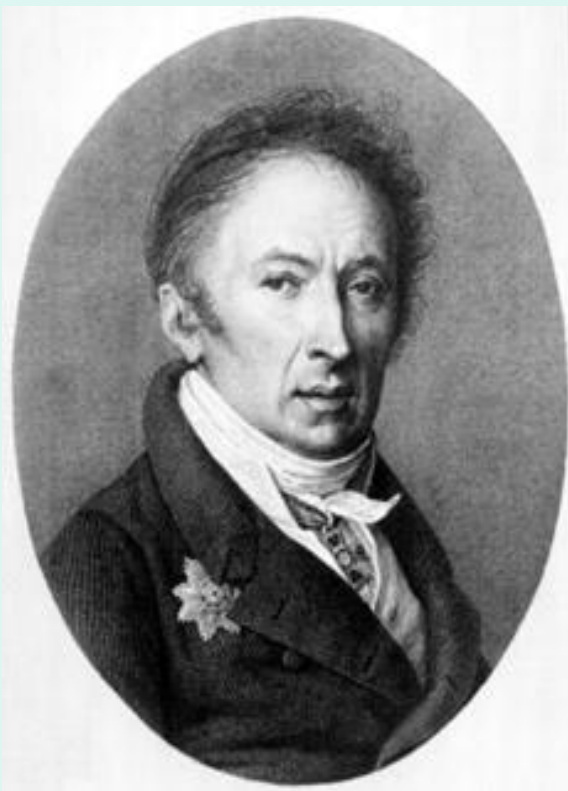
Николай Михайлович Карамзин (1766–1826), писатель, государственный историограф Российской империи (с 1803 г.)