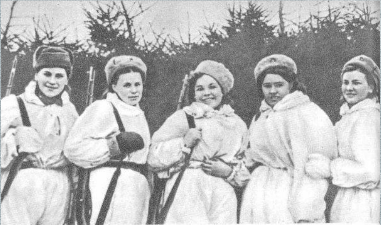
Девушки-снайперы, отличившиеся в боях за Восточную Пруссию. 1945 г.