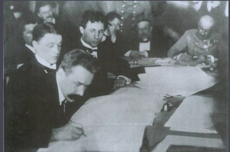
Підписання Берестейського миру. 1918 р.