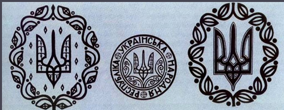
Герб і печатка УНР