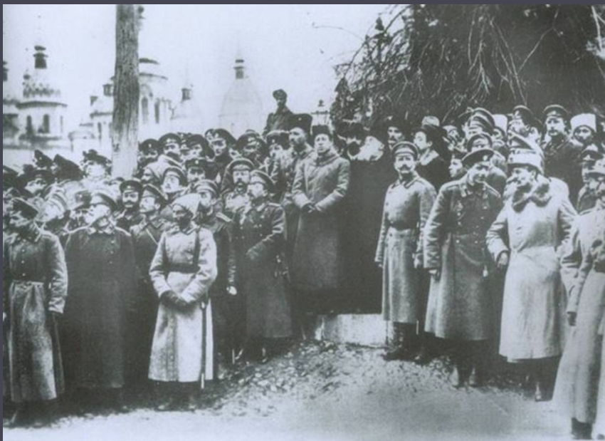
Проголошення III-го Універсалу. Київ, листопад 1917 р.