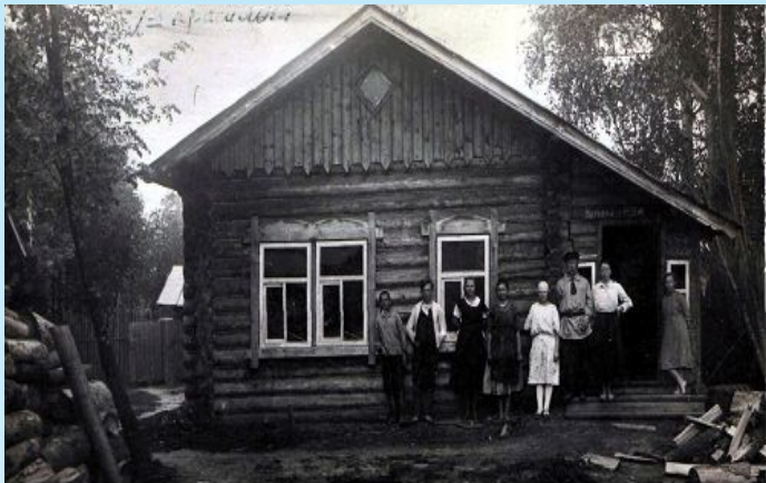
Здание школы ХОД - красильная мастерская.