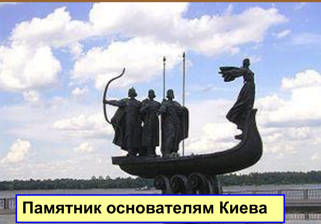
Памятник основателям Киева

В летописи «повесть временных лет» (12 в.) рассказывается об основании города на высоком берегу Днепра одним из вождей полян Кием и его братьями (прибл. в 5-6 вв.).