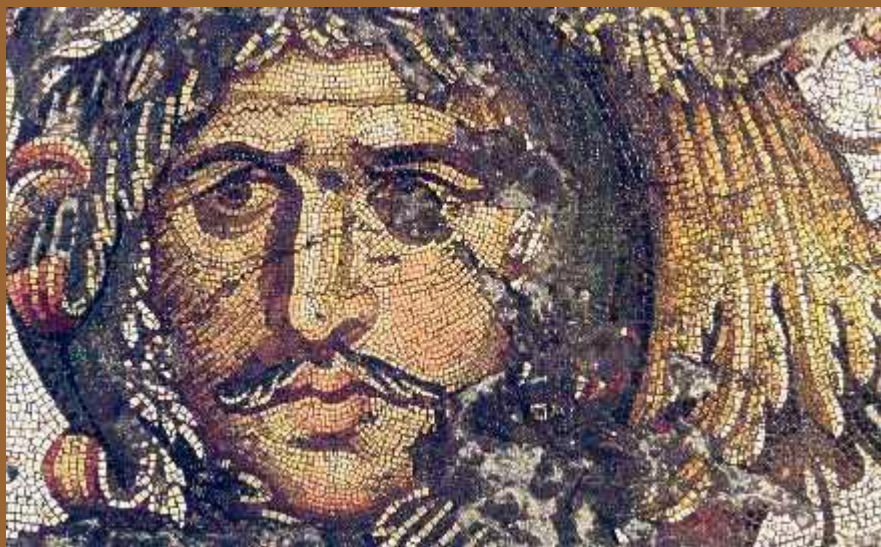
Мозаика – вождь готов

Первыми (2-3 вв. н.э.) начали переселение готы (из Скандинавии к югу, до Черного моря и далее на территорию Римской империи)