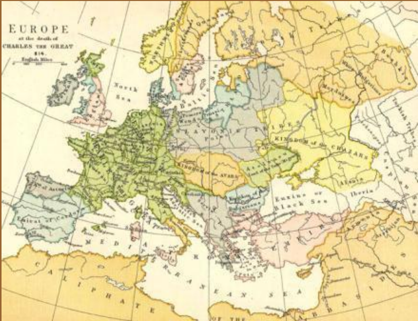
Государство авар к 814 г.