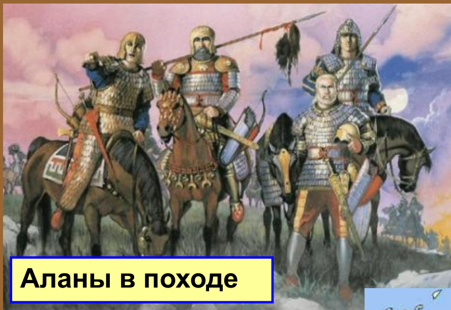
Аланы в походе

В 451 г. на Каталаунских полях гунны были разбиты римлянами и их союзниками (битва народов).