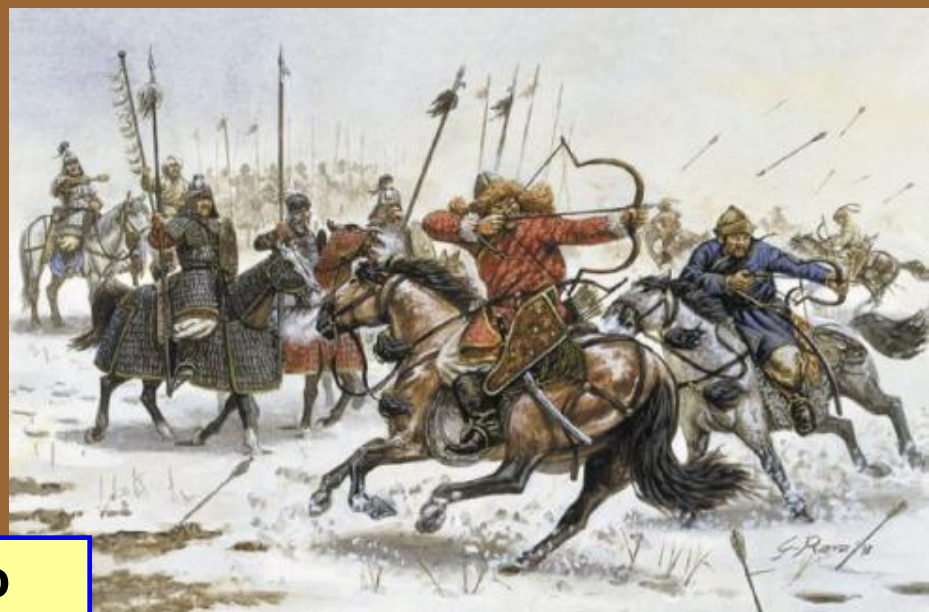
Гунны в бою

С 370-х гг из глубин Азии нахлынули гунны, включая покоренные племена в свое движение и уничтожая противящихся.