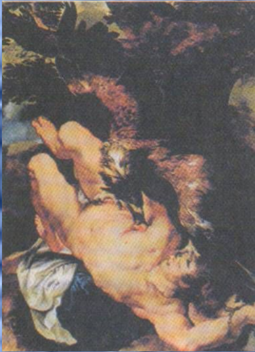
П.Рубенс и Ф. Снайдерс. «Прикованный Прометей»