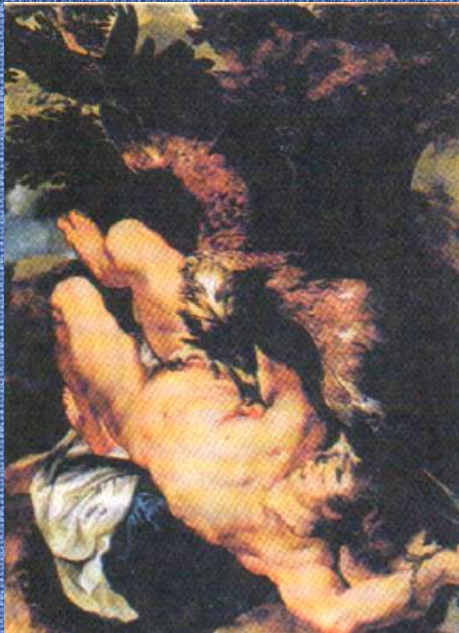
П.Рубенс и Ф. Снайдерс. «Прикованный Прометей»