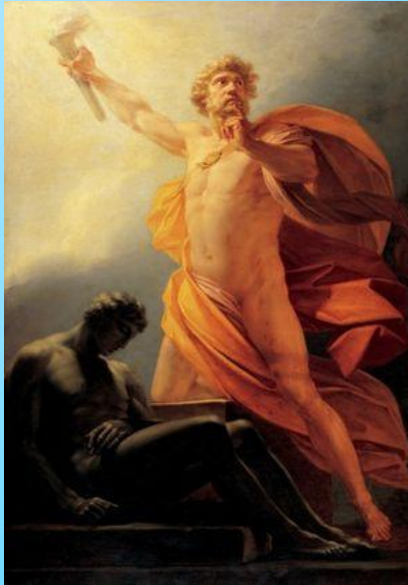
Генрих Фридрих Фюгер «Прометей несёт людям огонь». 1817