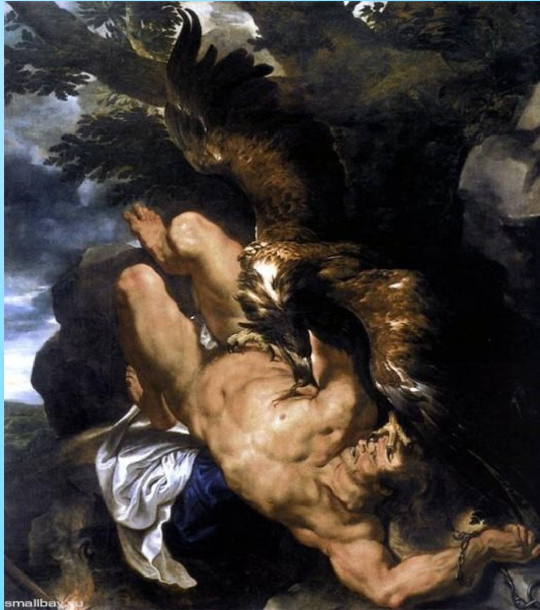
Рубенс Питер Пауль «Прометей Прикованный». 1610 - 1612