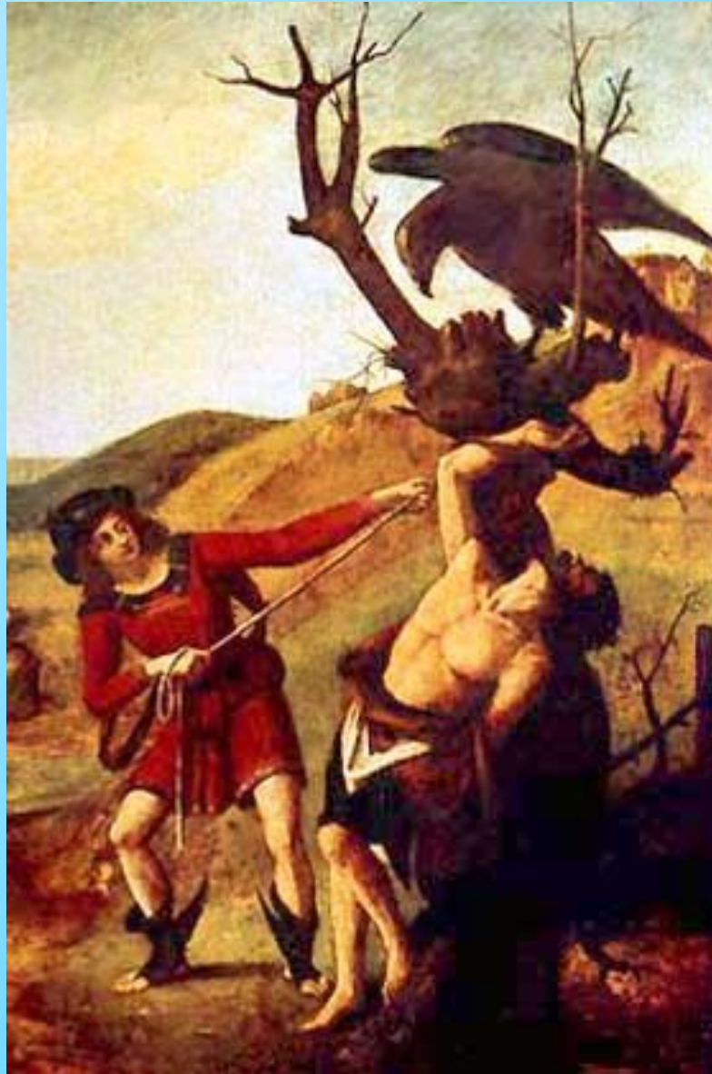
Пьеро де Козимо. Около 1500