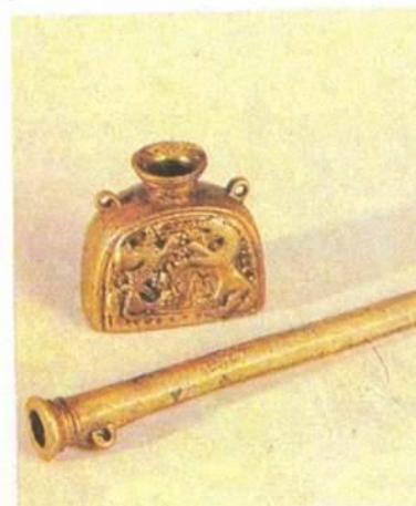
Подсвечник, свечные щипцы. Чернильница, футляр для перьев (перница) (первая половина XVIII в.)