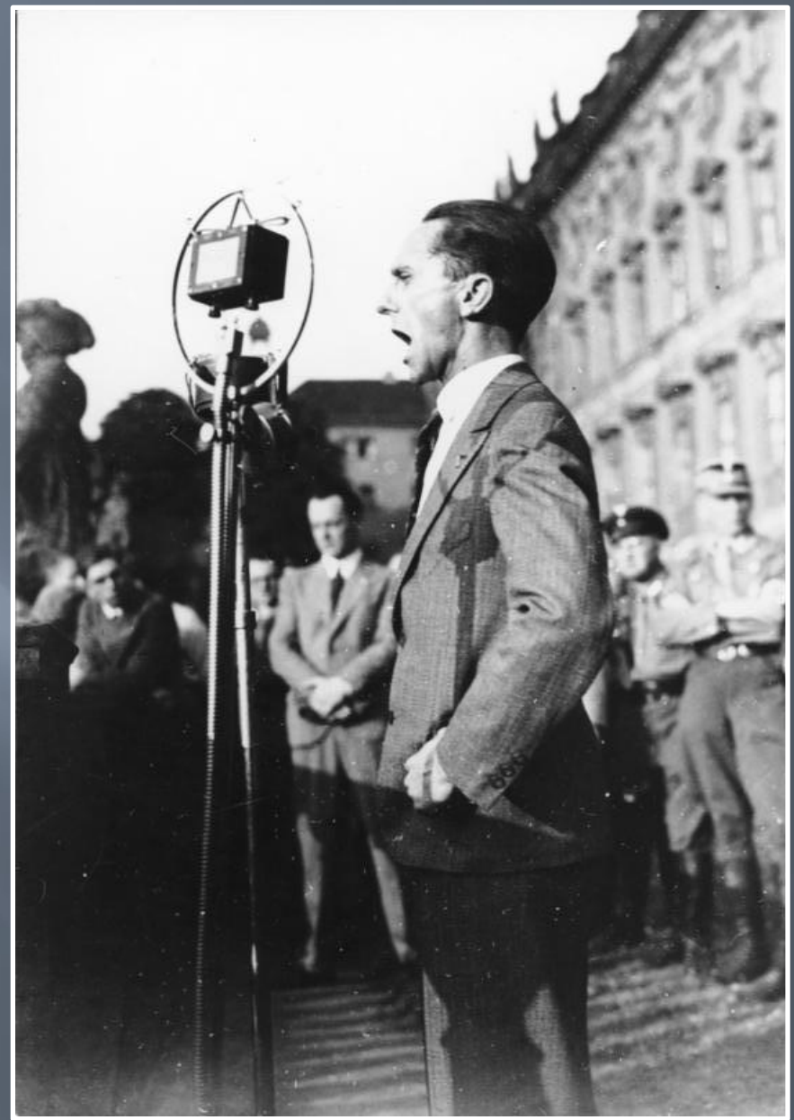
Геббельс оголошує "заповіді націонал-соціаліста"