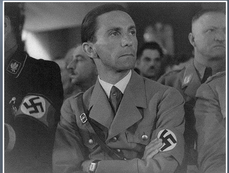
Геббельс на зборах НСДАП