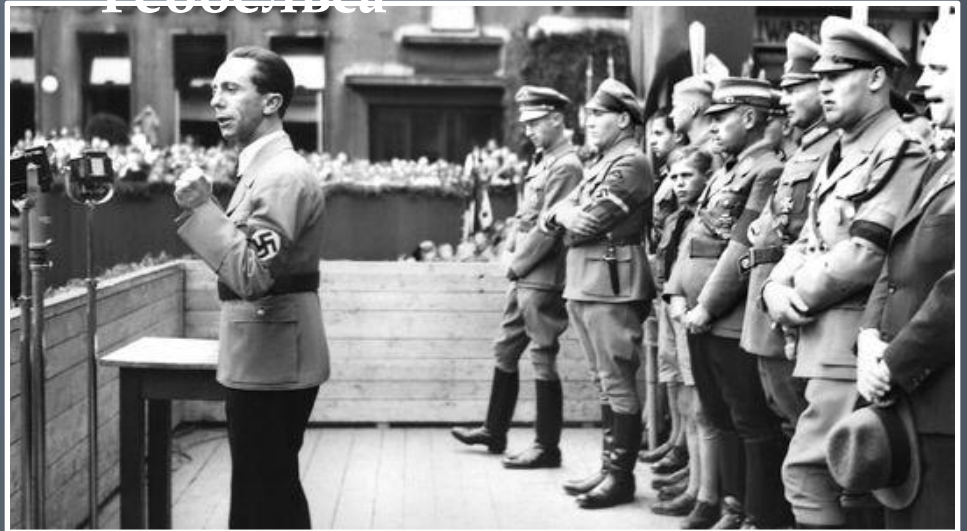
Виступ перед народом у Берліні