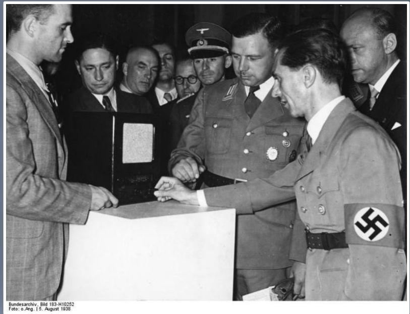
Геббельс осматривает на радиовыставке народный приёмник, 1938 г.