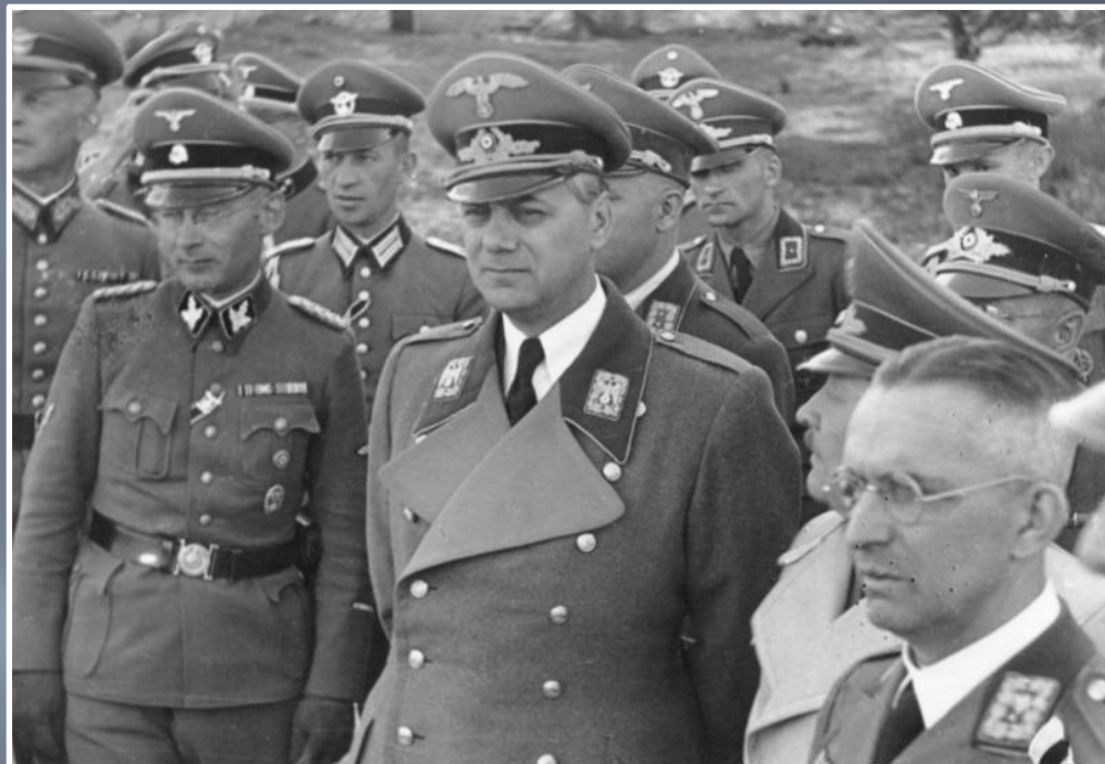
Альфред Розенберг, 1942 в Києві