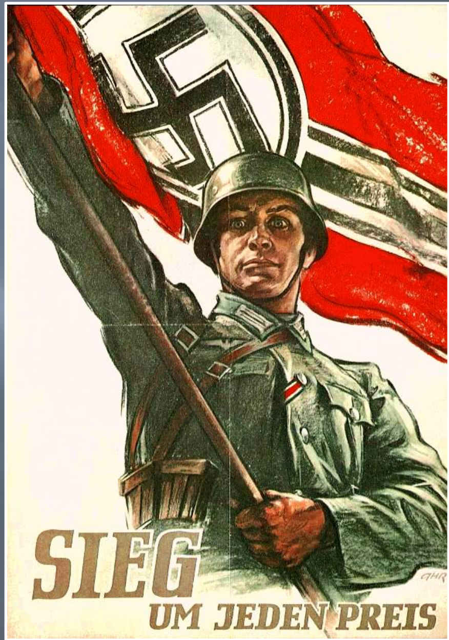
Німецький плакат «Перемога будь-якою ціною»