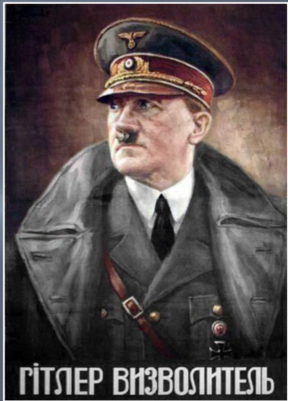
Німецький плакат на українській мові «Гітлер —

□ Гітлер був чудовим оратором, відчував настрої натовпу, що дозволяло йому швидко набирати популярність, перетворившись на свого роду рушійну силу пропагандистської кампанії, витягнувши маленьку партію з пивниго бару на велеликолюдні мітинги. Вперше він виступив на