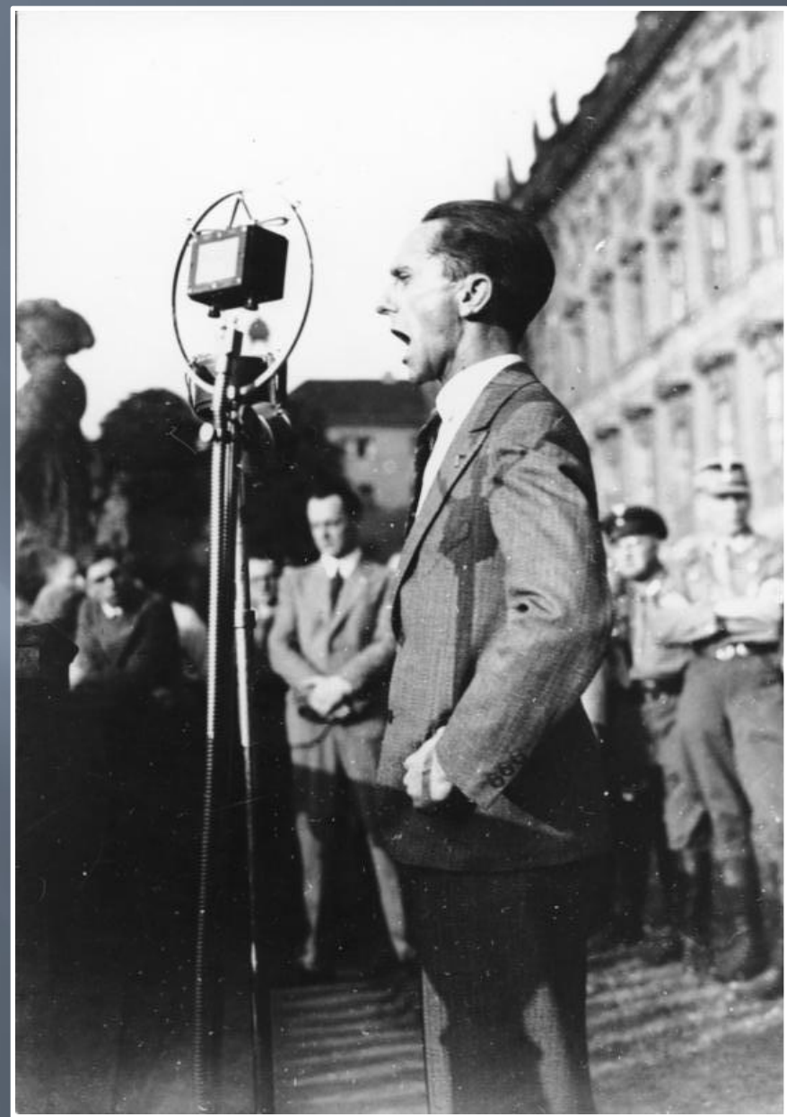
Геббельс оголошує "заповіді націонал-соціаліста"