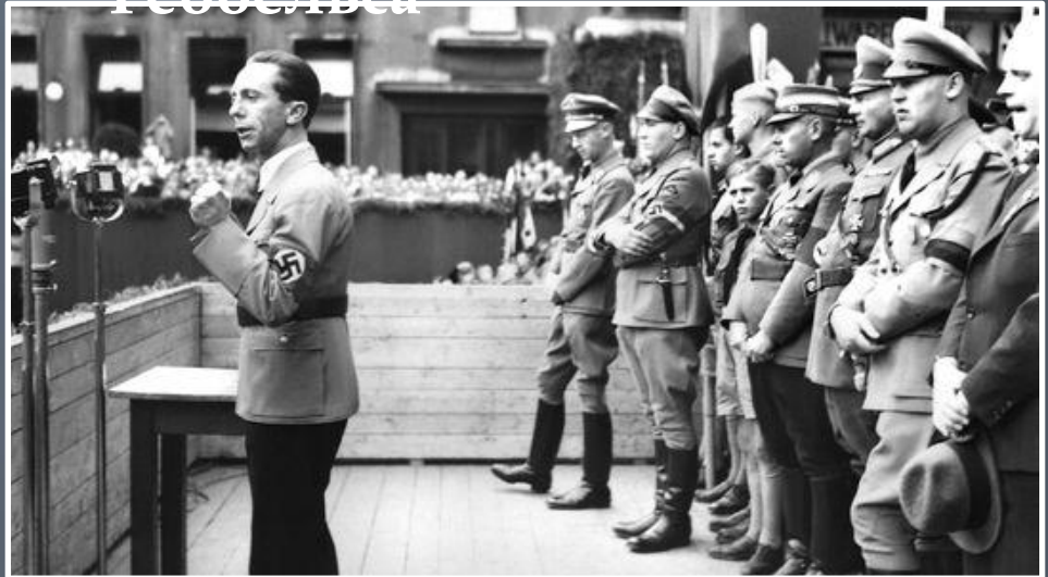
Виступ перед народом у Берліні