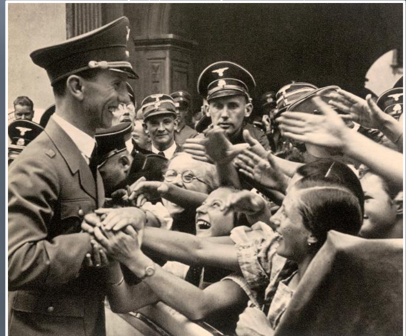
Геббельс осматривает на радиовыставке народный приёмник, 1938 г.