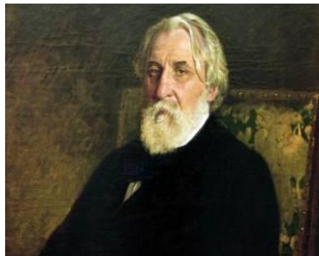
И.С.Тургенев «Отцы и дети»

3) Под влиянием различных смутных чувств , сознания уходящей жизни, желания новизны она заставила себя дойти до известной черты, заставила себя заглянуть за неё – и увидала за ней даже не бездну , а пустоту ... или безобразие .