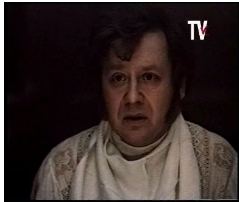
Илья Ильич Обломов из романа «Обломов».