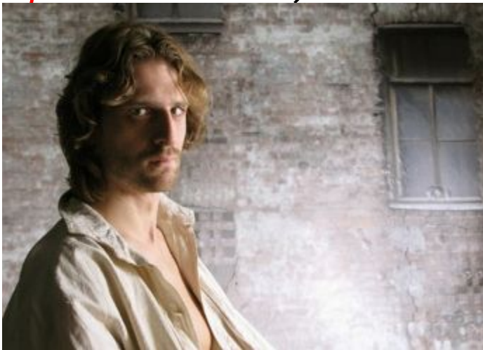
Родион Раскольников из романа «Преступление и наказание».

1) Раскольников разглядел худенькое, но милое личико девочки, улыбавшееся ему и весело на него смотревшее. (Осложнено однородными членами и обособленными определениями.)