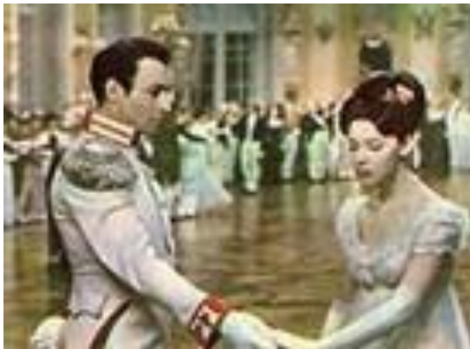
Андрей Болконский и Наташа Ростова . «Война и мир».