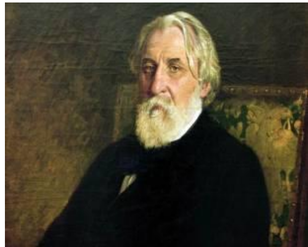
И.С.Тургенев «Отцы и дети»

3) Под влиянием различных смутных чувств , сознания уходящей жизни, желания новизны она заставила себя дойти до известной черты, заставила себя заглянуть за неё – и увидала за ней даже не бездну , а пустоту ... или безобразие .