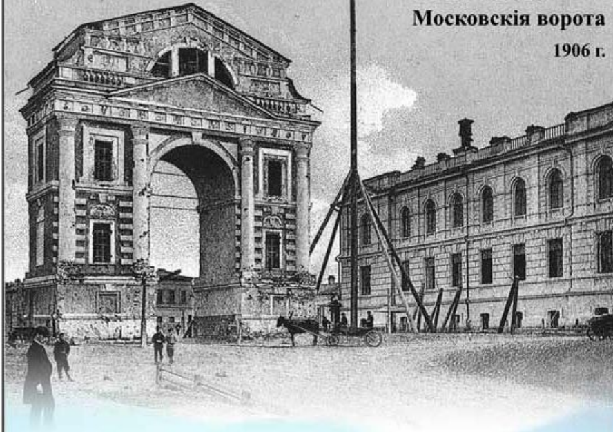
ИРКУТСКЪ. Московскія ворота 1906 г.