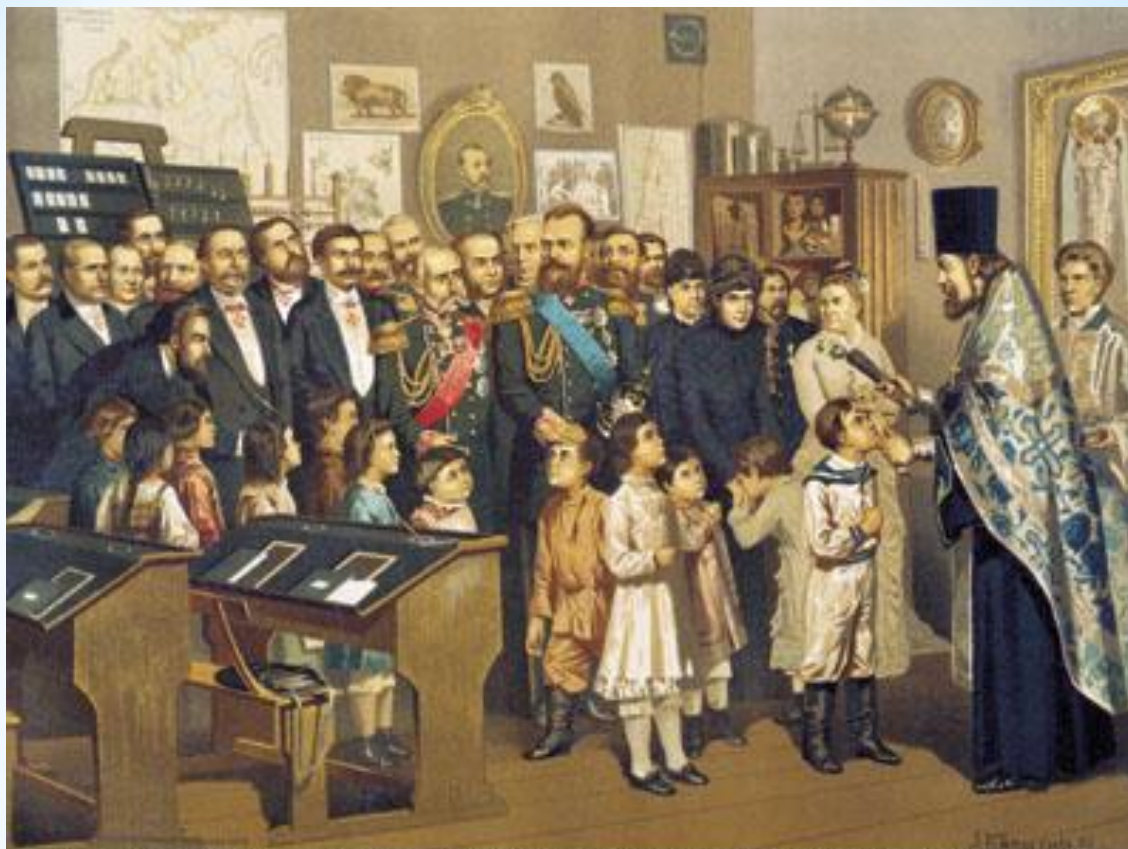
Кившенко А. Освящение народной школы в присутствии цесаревича Александра Александровича. 1880.

Распространялись церковно-приходские школы.