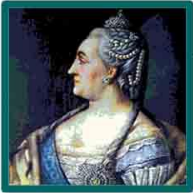
Екатерина II Великая