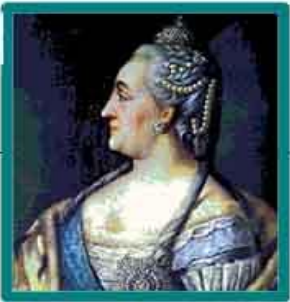
Екатерина II Великая