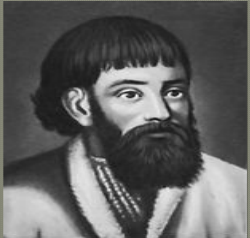
Е.И. Пугачев .