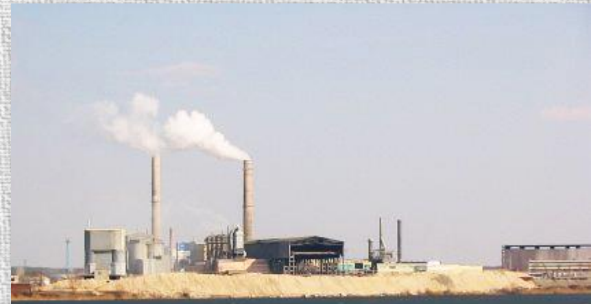
Кричевский цементный завод