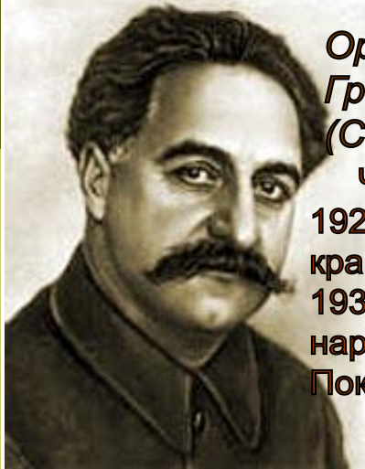
Орджоникидзе Григорий Константинович (Серго)

Член РСДРП с 1903г. 1922-1926- 1-й секретарь Закавказского крайкома РКП (б). 1932г.- Председатель ВСНХ, нарком тяжелой промышленности. Покончил жизнь самоубийством.