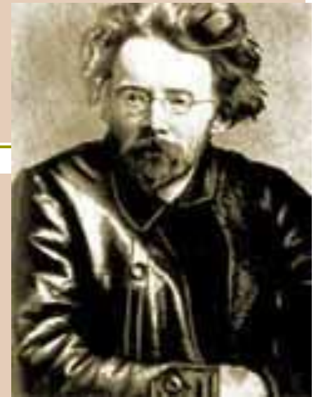
Пятаков Георгий Леонидович

1929-1930 - председатель правления Госбанка СССР. 1934 - 1-й зам. наркома тяжелой промышленности. Репресирован в 1936, расстрелян.