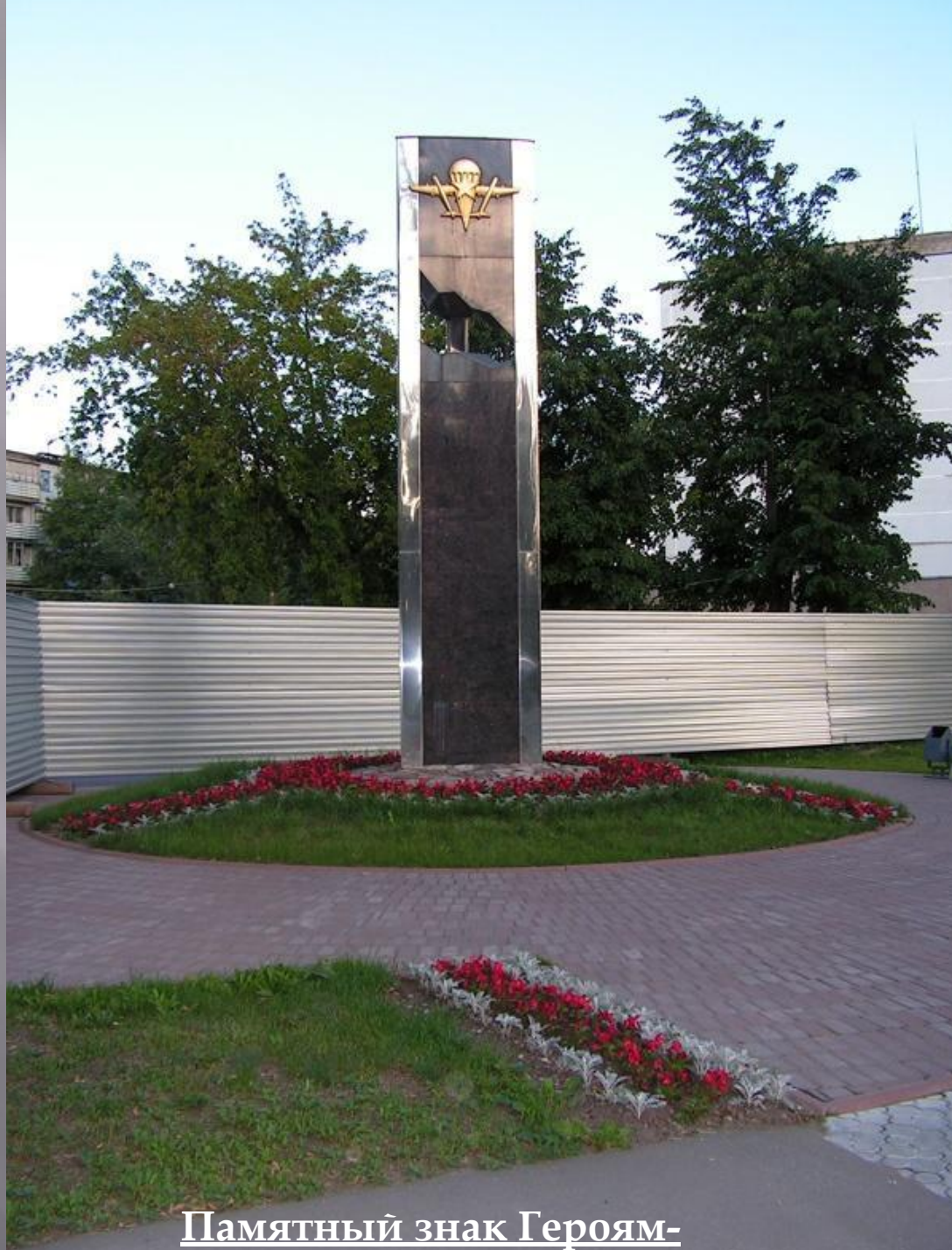
Памятный знак Героям-