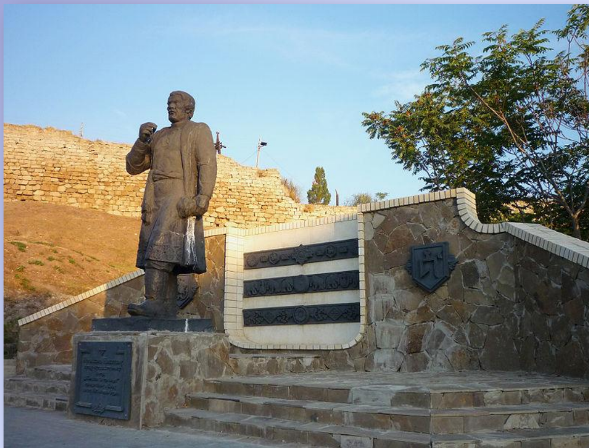
Памятник Афанасию Никитину в Феодосии.

Из Кафы с русскими купцами он отправился на родину.