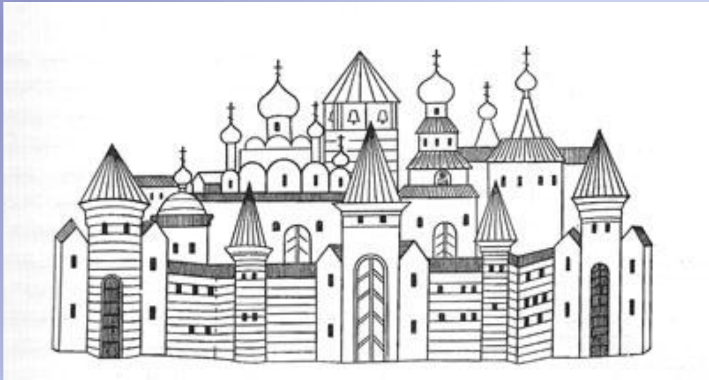
Тверской кремль в 15 веке.

«Поидох от Спаса святого златоверхого и с его милостию, от государя своего от великого князя Михаила Борисовича Тверского, и от владыки Генадия Тверского».