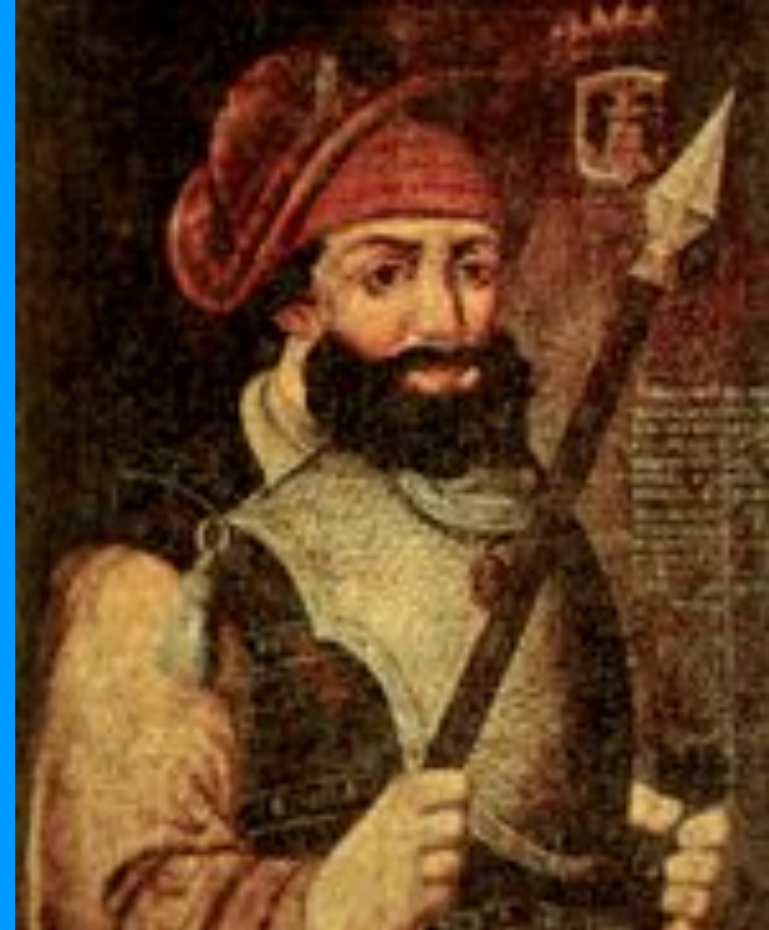
Казацкий атаман Ермак Тимофеевич