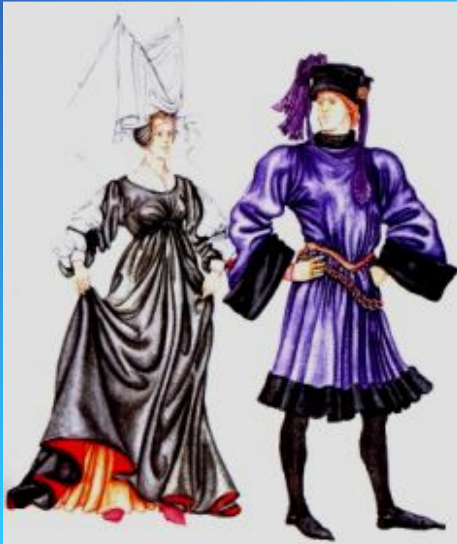
Платье – роб Чепец с покрывалом в виде паруса