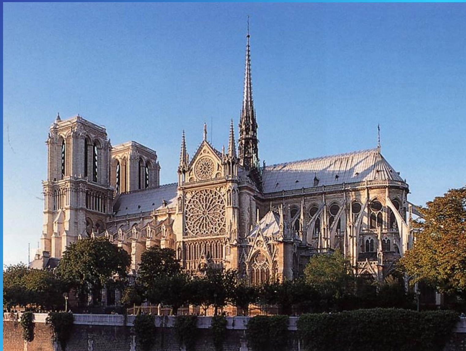
Собор. Нотр – Дам де Пари