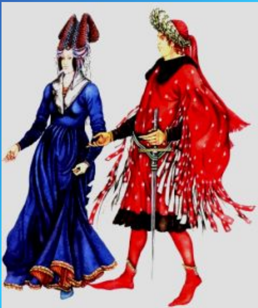
Двурогий эннен Платье – роб