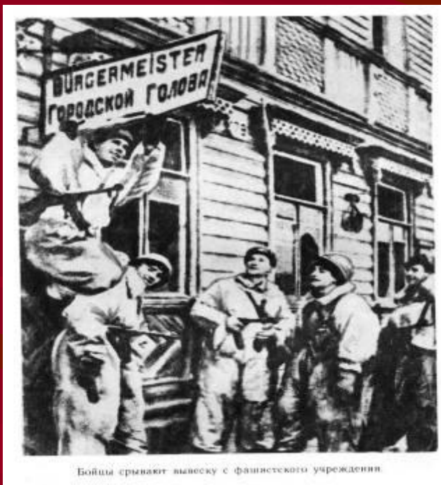
Бойцы срывают вывеску с фашистского учреждения.

По сегодняшний день на улице сохранилось здание, в котором в годы Великой Отечественной войны располагался Городской Голова, один из вершителей судеб жителей оккупированного Красногвардейска.