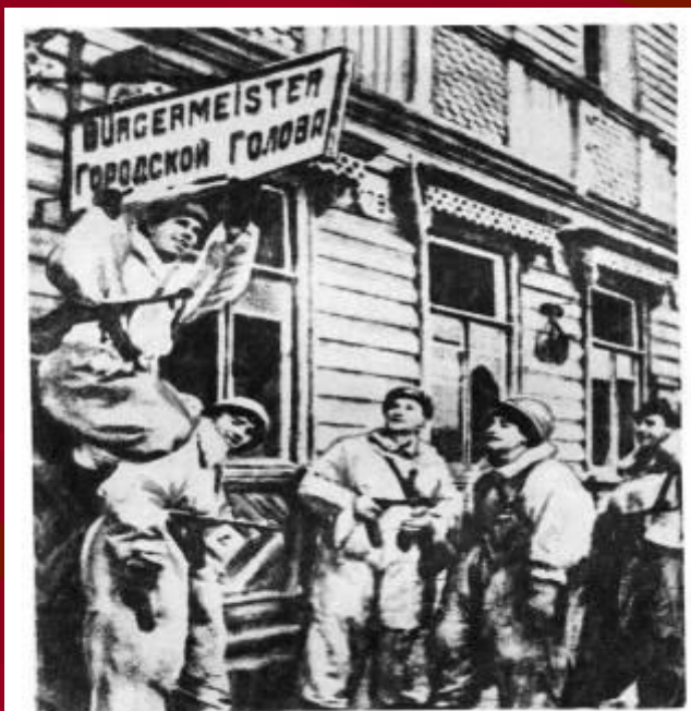
Бойцы срывают вывеску с фашистского учреждения.

По сегодняшний день на улице сохранилось здание, в котором в годы Великой Отечественной войны располагался Городской Голова, один из вершителей судеб жителей оккупированного Красногвардейска.