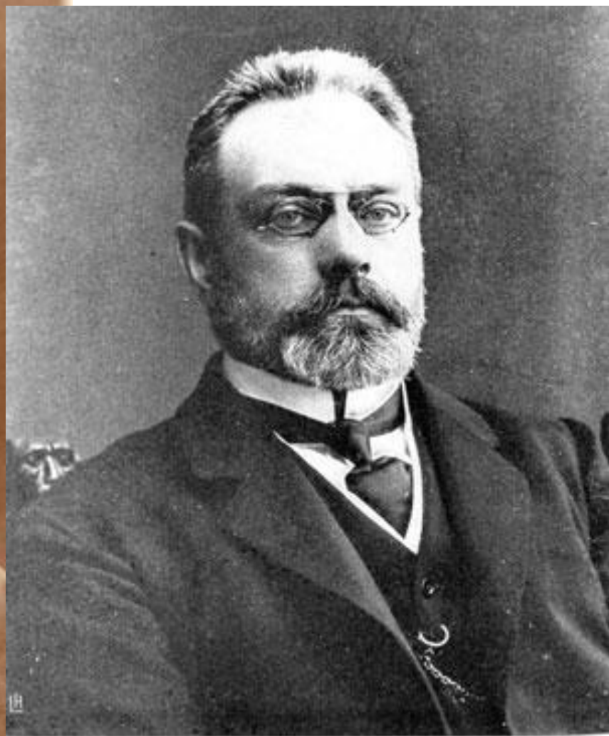
А. И. ГУЧКОВЪ. Военный министръ и временно морской.