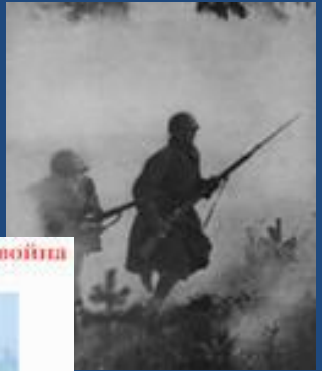
Великая Отечественная война (1941 – 1945 г.г.)