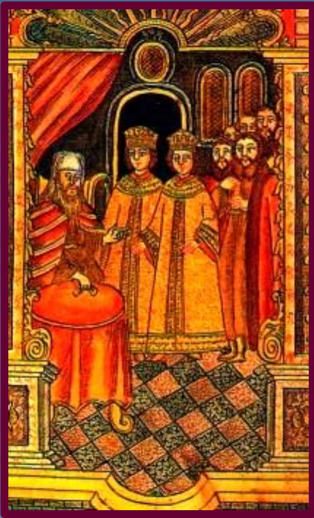
Петр, Иван и патриарх Андриан. Миниатюра к. 17 в