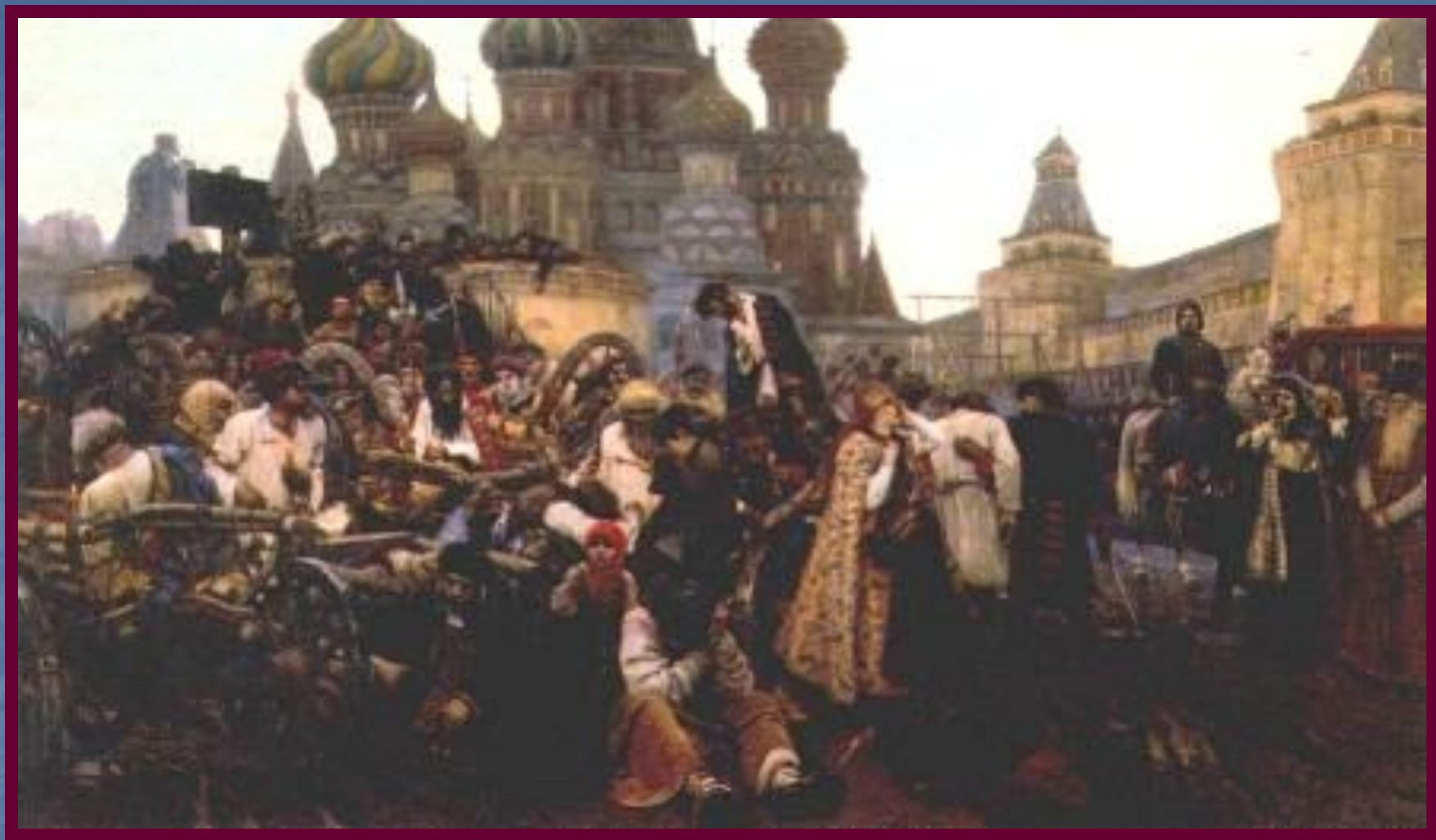
В.Суриков. Утро стрелецкой казни.