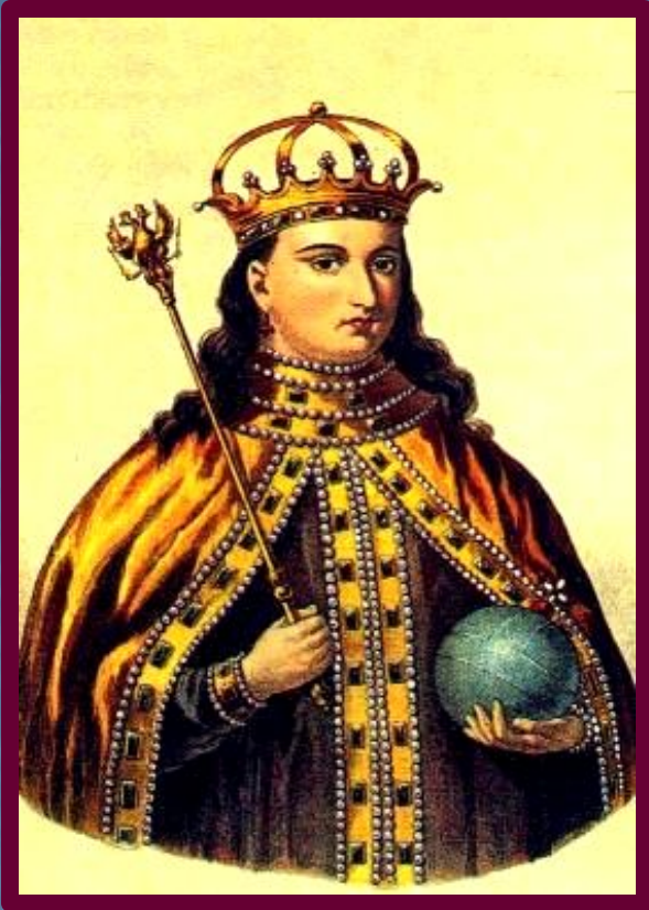
Царевна Софья. Современный рисунок

Власть оказалась в руках Софьи, за которой стояли Милославские и ее фаворита В. Голицына. Они начали преобразования, но вынуждены были постоянно следить за Петром и Нарышкиными, чтобы не потерять власть.