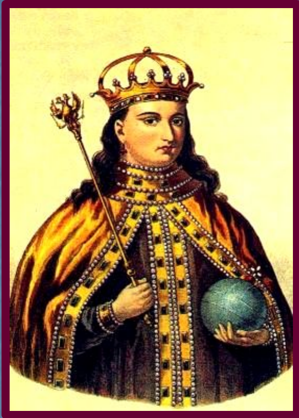
Царевна Софья. Современный рисунок

Власть оказалась в руках Софьи, за которой стояли Милославские и ее фаворита В. Голицына. Они начали преобразования, но вынуждены были постоянно следить за Петром и Нарышкиными, чтобы не потерять власть.