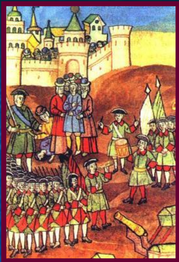
Осада Азова. Миниатюра к. 17 в

В 1695 г. Петр I желая завоевать выход к Черному морю отправился к Азову и осадил его. Но турки подвозили все необходимое по морю.