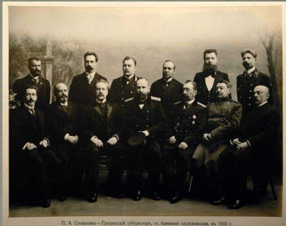
П. А. Столыпинъ — Гродненский губернаторъ, съ бывшими сослуживцами, въ 1903 г.