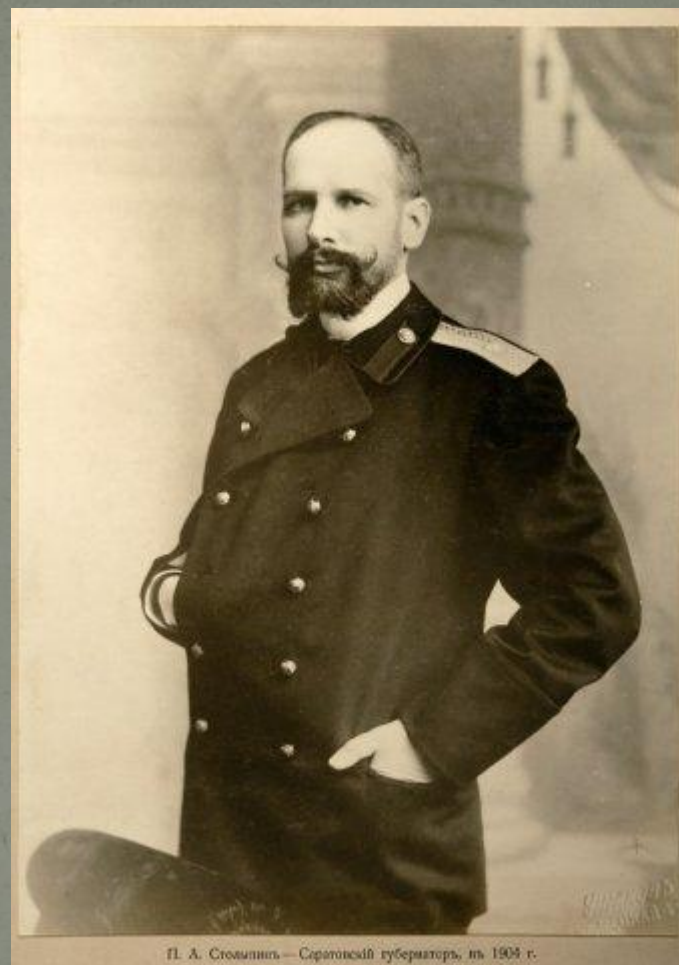
П. А. Столыпин — Саратовский губернатор, июль 1904 г.