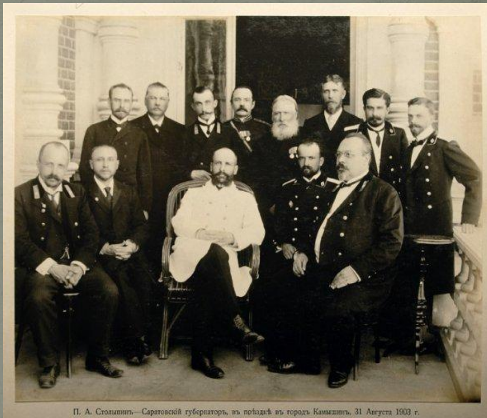
П. А. Столыпин — Саратовский губернатор, в поездке в город Камышин, 31 августа 1903 г.