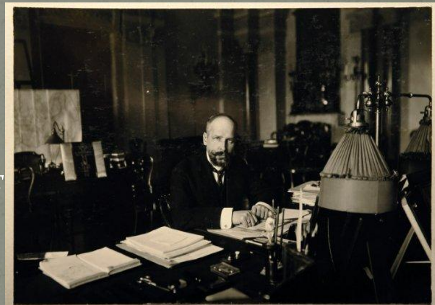
П. А. Столыпинъ, въ его кабинетѣ въ Зимнемъ Дворцѣ въ 1907 г.