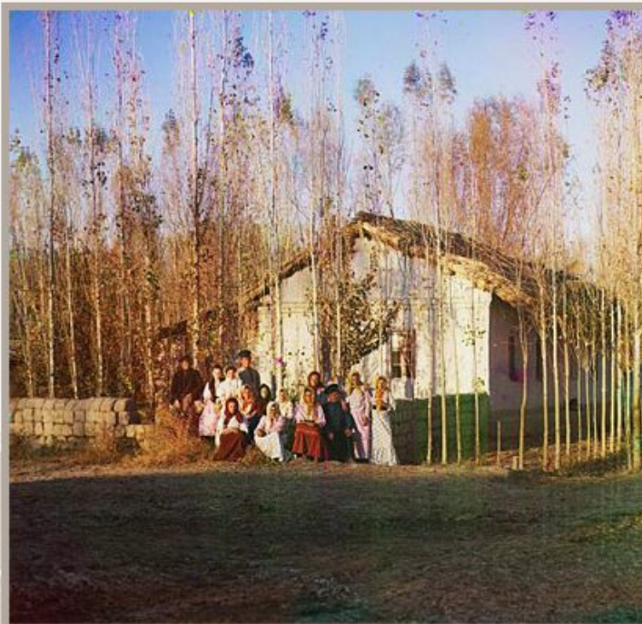
Крестьяне-переселенцы. С.М. Прокудин-Горский. Фото 1910-х гг.

Случаи обратного возвращения переселенцев из Сибири на родину, хотя и были, не в незначительном количестве».