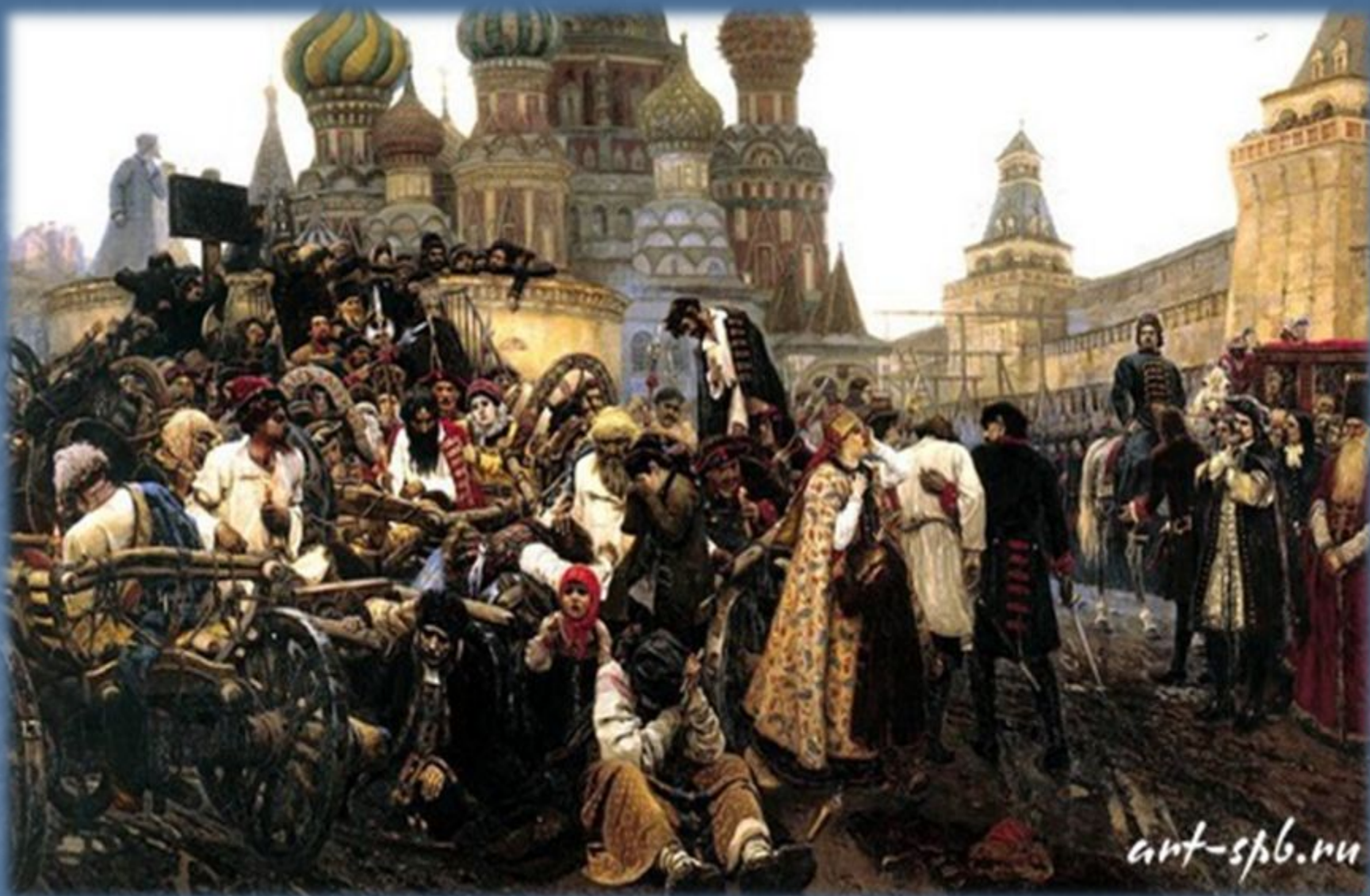
Картина В.И. Сурикова «Утро стрелецкой казни»