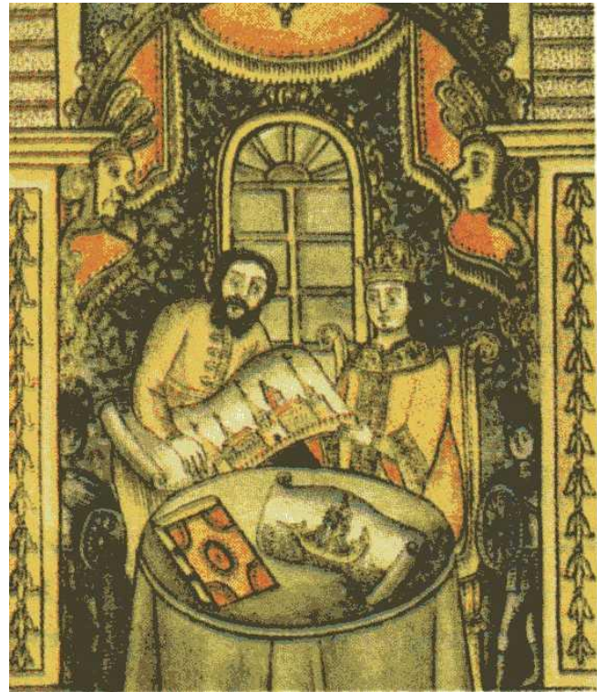
Никита Зотов обучает юного Петра I