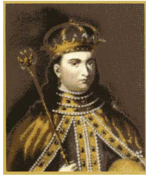
Царевна Софья Алексеевна

Регенство – временное осуществление полномочий главы государства в связи с малолетством или болезнью монарха