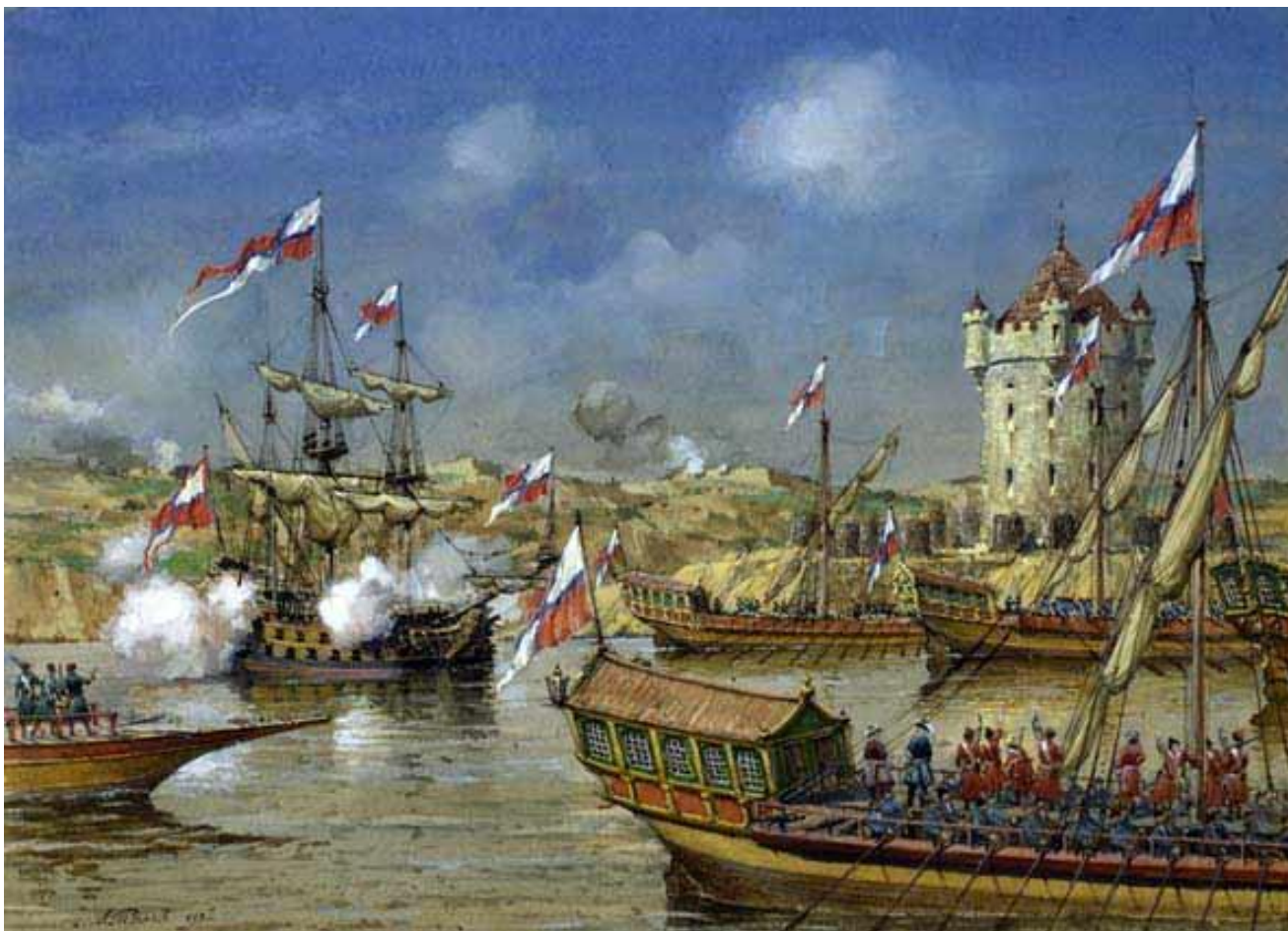
Взятие русскими войсками и флотом Азова в 1696 г.