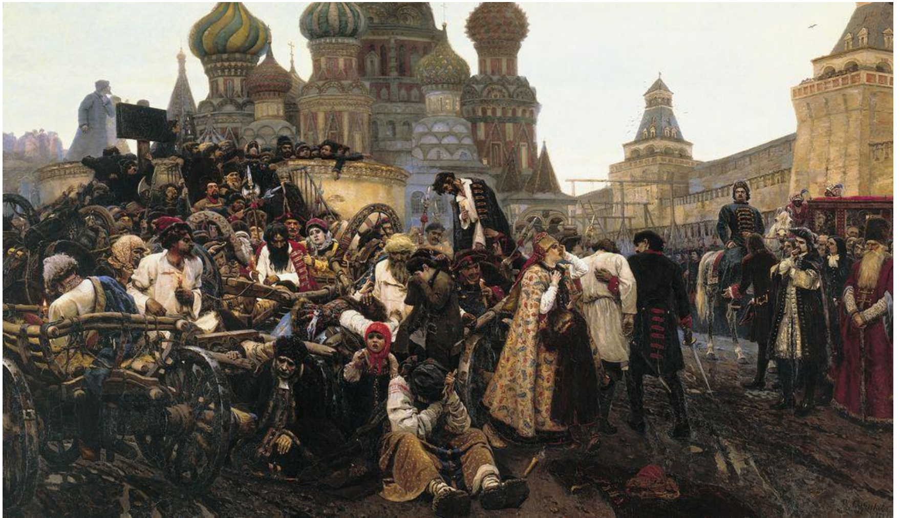
Утро стрелецкой казни. Художник В. И. Суриков