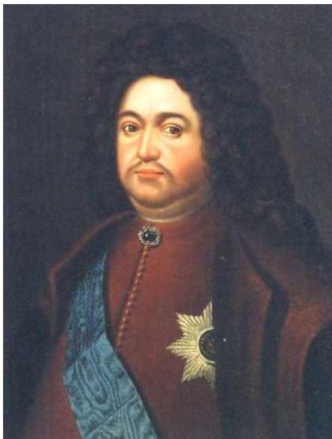
Головин Ф. А.

Руководителями посольства были назначены генерал-адмирал Ф. Я. Лефорт, руководитель Посольского приказа генерал Ф. А. Головин и думный дьяк П. Б. Возницын.