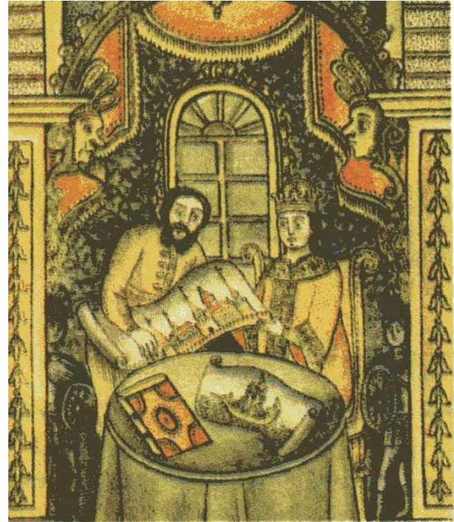
Никита Зотов обучает юного Петра I