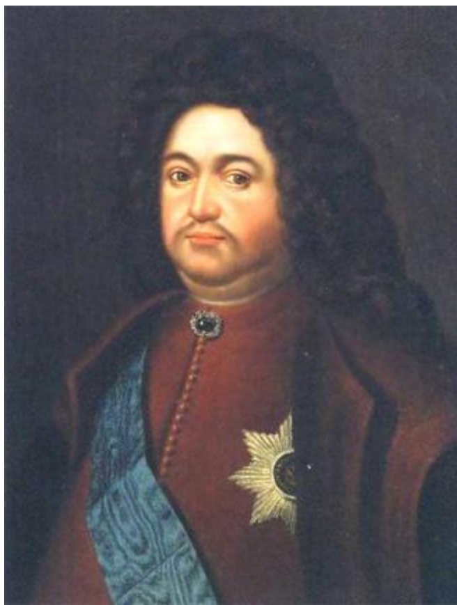
Головин Ф. А.

Руководителями посольства были назначены генерал-адмирал Ф. Я. Лефорт, руководитель Посольского приказа генерал Ф. А. Головин и думный дьяк П. Б. Возницын.