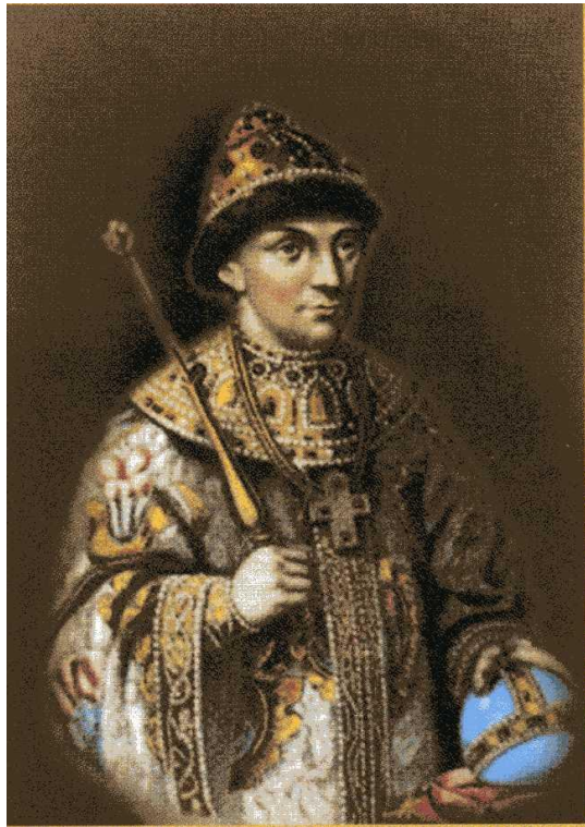
Фёдор Алексеевич Романов