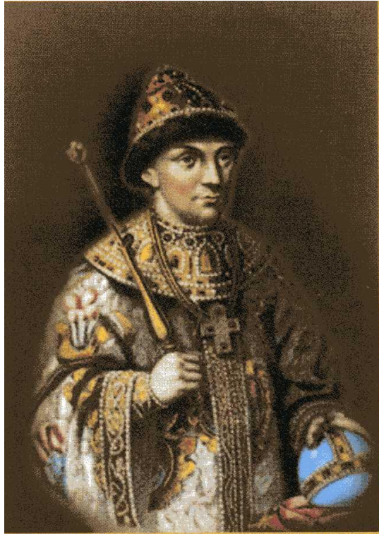
Фёдор Алексеевич Романов