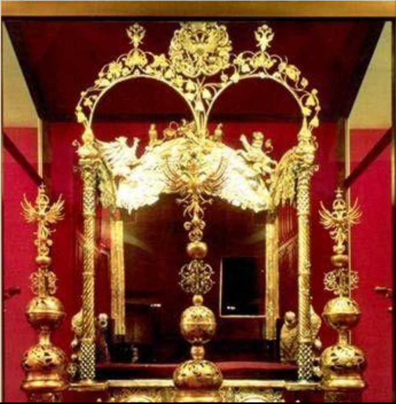
Двойной трон в Оружейной палате