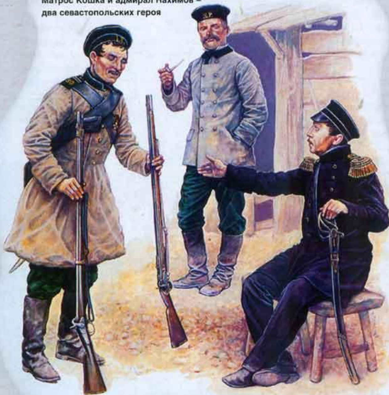
Матрос Кошка и адмирал Нахимов – два севастопольских героя