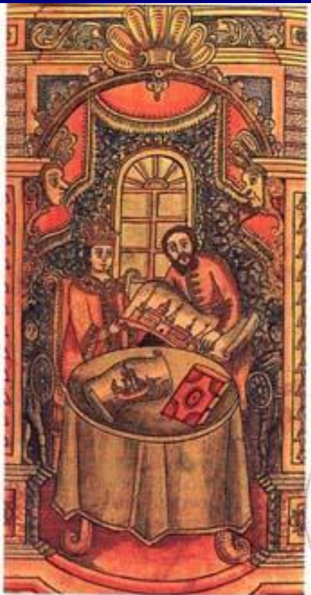
Дьяк Н.М. Зотов обучает царевича Петра Алексеевича. Миниатюра первой половины XVIII в.

Дьяк Н.М.Зотов обучает царевича Петра Алексеевича. Миниатюра первой половины 18 века.