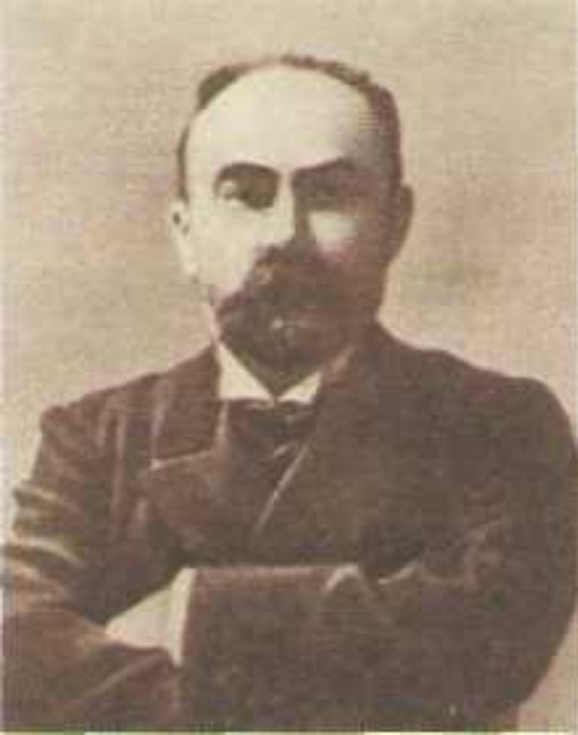
фото Г. В. Плеханова « Первого русского марксиста»