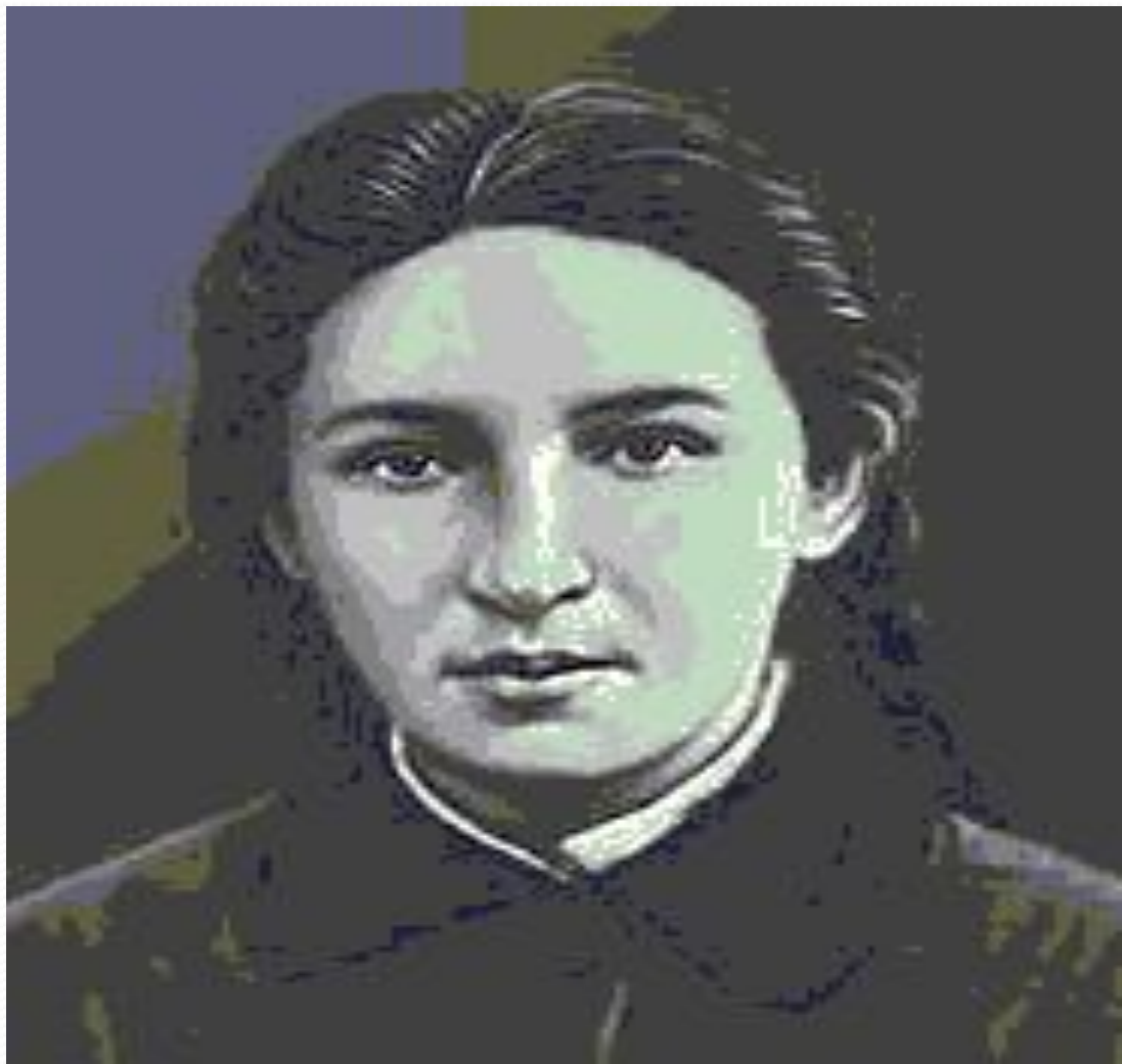
Фото В. Засулич