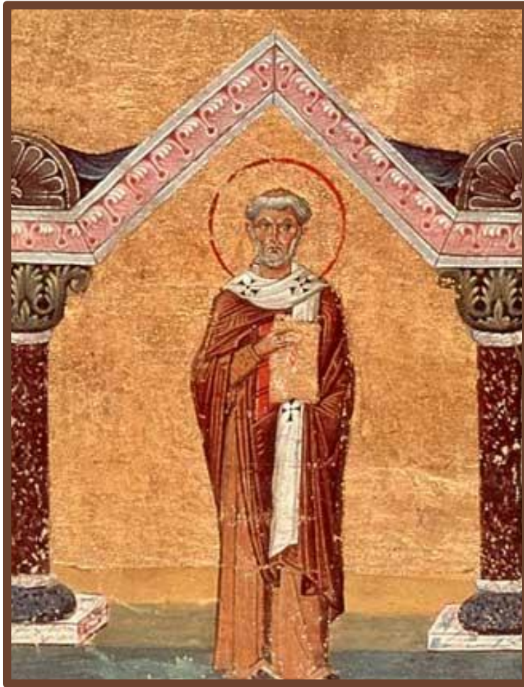
Папа Лев I