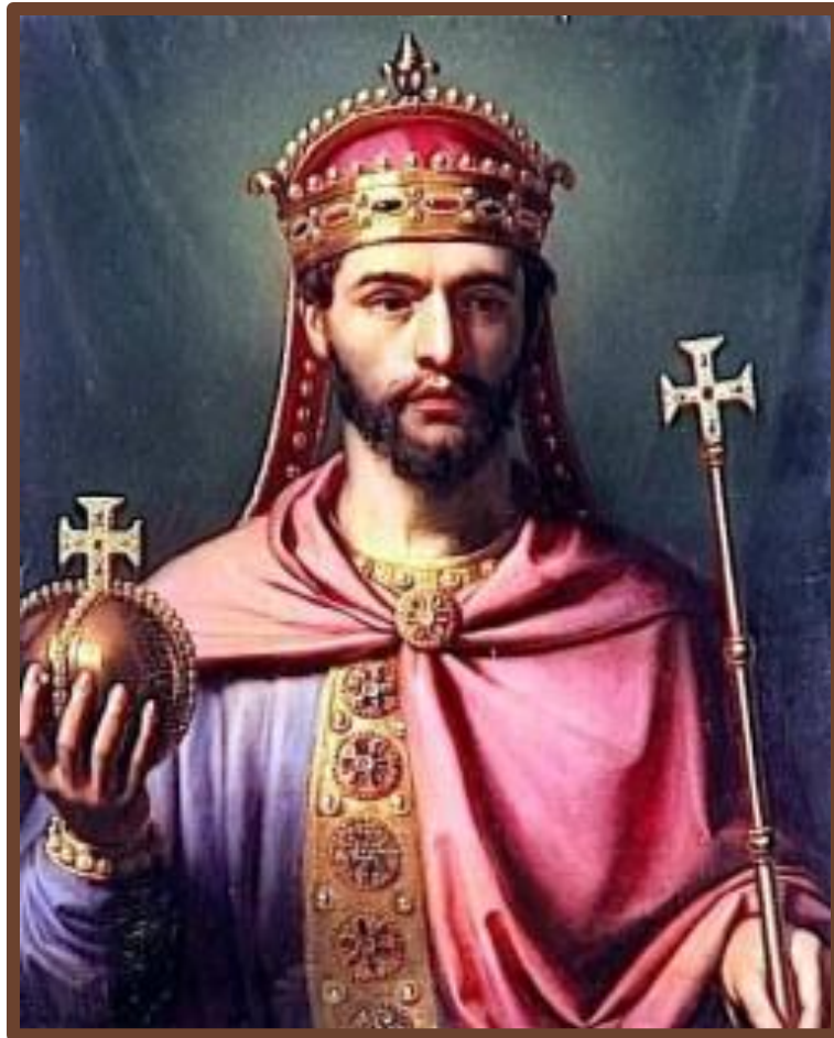
Людовик I Благочестивый

Смерть – развал империи. 814 - 840 г. – Людовик I – выделил земли Лютарю, Людовику и Карлу – усобицы 843 г. – Верденский раздел. Феодальная раздробленность. «Вассал моего вассала - не мой вассал».