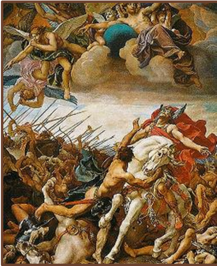
Битва при Толбиаке. Смерть короля вестготов

IV – V вв. – Великое переселение народов